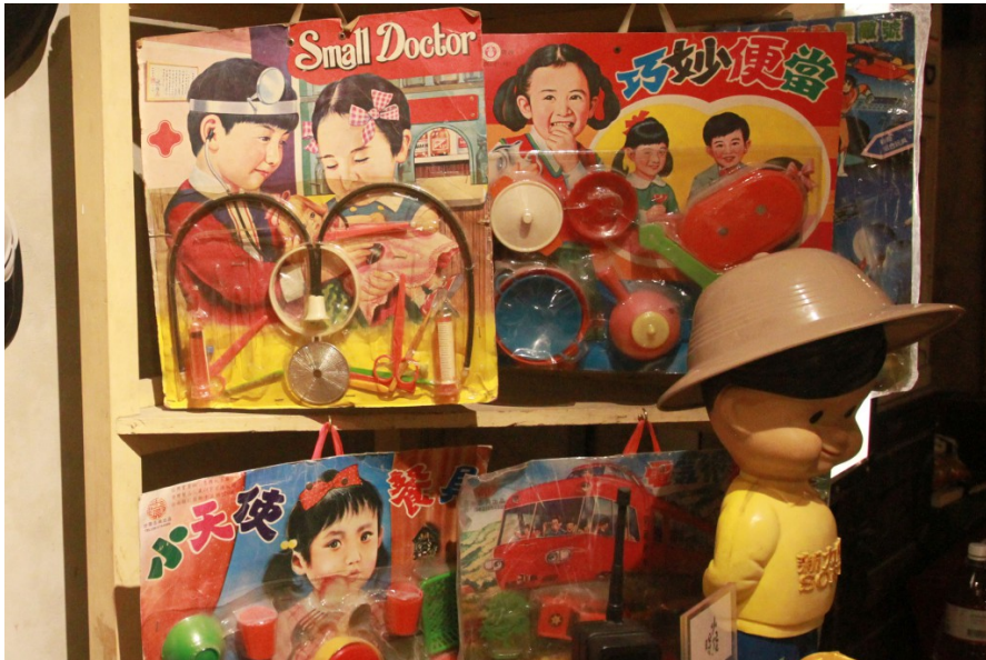
早期的玩具介紹都是用手繪的方式呈現，畫風相當寫實精緻。