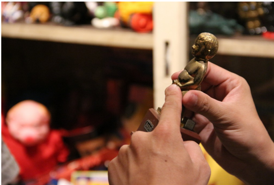
尿尿小童的造型，早期曾被做成打火機。