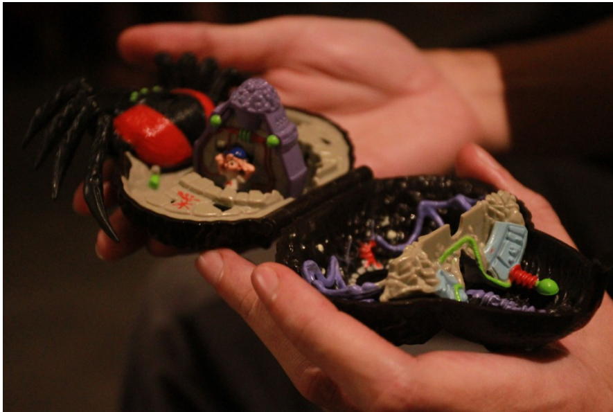
口袋怪獸是7年級生男孩必備玩具，打開後裡面有許多小怪獸。