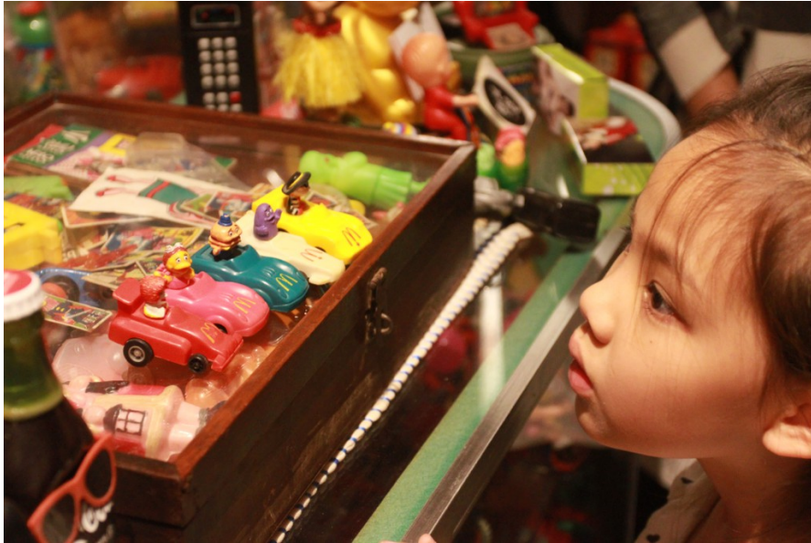
除了麥當勞叔叔，曾經還有漢堡神偷、大鳥姐姐、奶昔大哥等相關吉祥物， 現在的孩子都已經不認識。