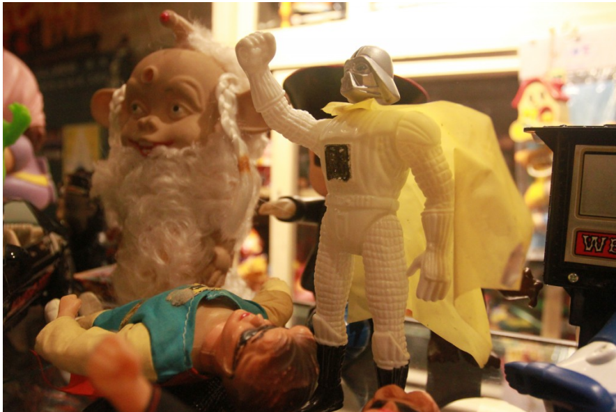
盜版的玩具在台灣早期很常出現，圖為星際大戰 (star wars) 中的黑武士。