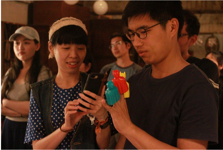
第一次看到三個顏色的蝙蝠俠 (Batman)，參觀者拍照留念。