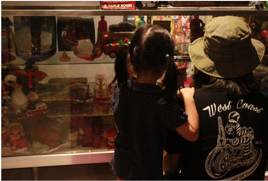
父親帶著女兒欣賞自己小時候的玩具。(照片來源/郭宜婷攝)

大力水手卜派 (Popeye the Sailor) 在台灣早期出現粉紅色的版本。(照片來源/郭宜婷攝)