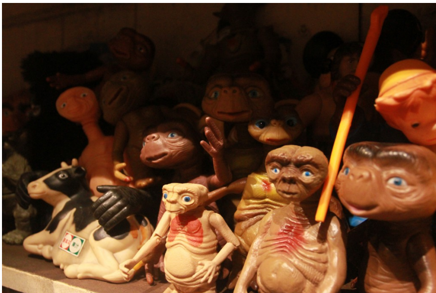
早期台灣常常將外國電影角色做成玩具，由於每隻都是純手工，因此長相都不太一樣。