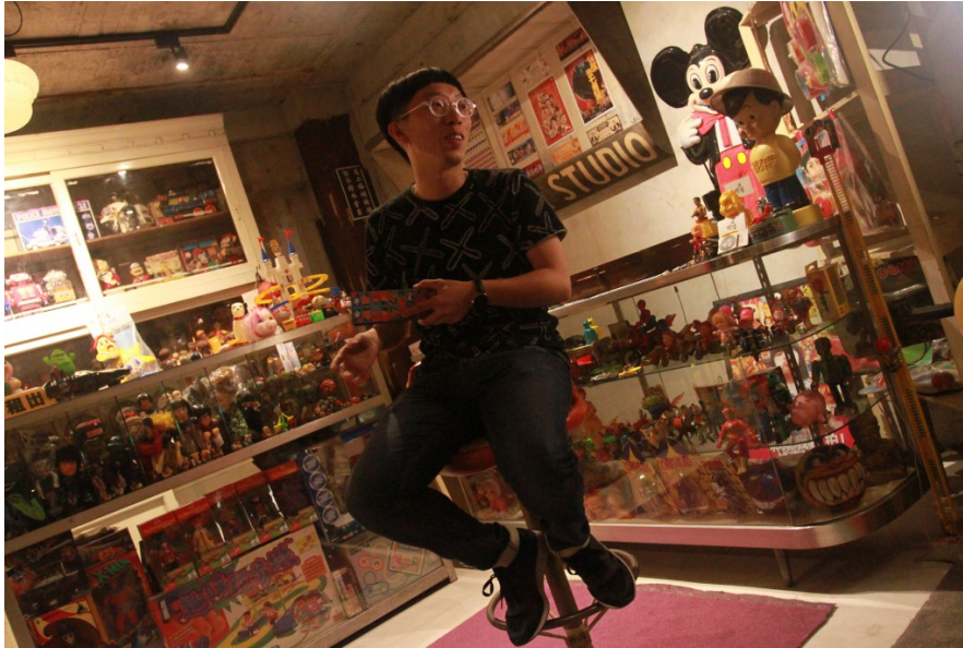
「1982小時候」創辦人大大D向來參觀的人們介紹他的收藏品。

台中有一間專門收藏老玩具的空間，這裡就像是另一個時空，與外面的世界有所切割。「1982小時候」致力於蒐集各式各樣的童年玩具，他們不做買賣，僅供參觀，期許更多玩家一同交流彼此的童年記憶，也期望年輕一代的孩子能感受到這些老玩具的溫度與魅力。