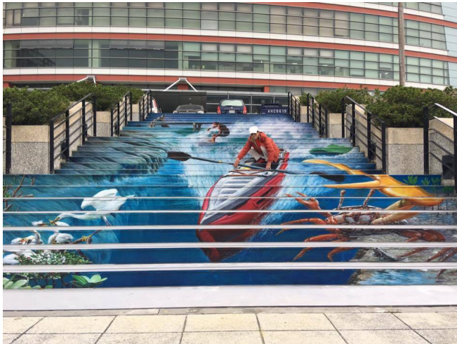
此為繪於臺北港的3D立體地景畫作。

「要怎麼把構想轉成3D才是真正的困難，不過既然答應人家那就要畫出來，而且這同時也是為自己做形象廣告呀。」魏榮欣為此傷透腦筋，不過仍然努力嘗試，最後他自我領悟到繪製3D的精隨，那就是「比例」。2D創作容易上手，3D卻很困難，因為要考慮角度以及在地面或樓梯的比例縮放，而這些全由魏榮欣自己研究出來，爾後分別在苗栗縣三義鄉、關西服務區、金門、臺北港等地，都有出現他所創作的3D立體地景畫作。