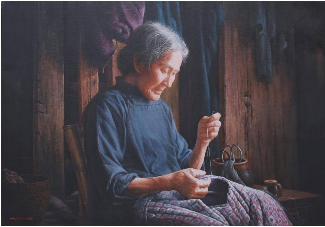
「補衣的老婦」，獲得第二屆新唐人全世界華人人物寫實油畫大賽銀牌獎。