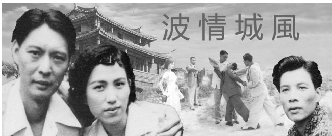
圖為「風城情波」設計稿。