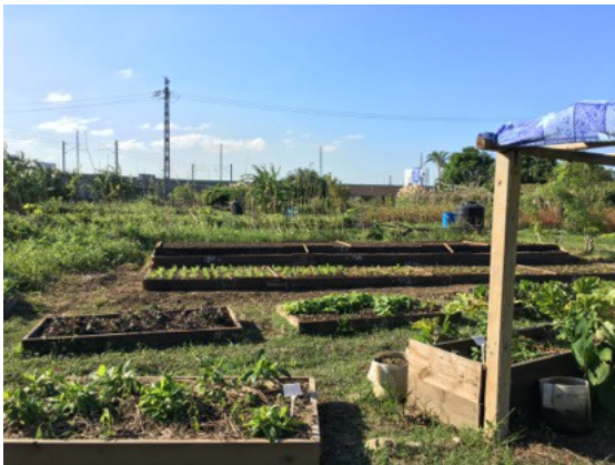
千甲農場一隅

「不起眼的東西，其實它是最感動人的，我們是都市原住民，都來自不同的族群，雖然那位爺爺不是原住民，但你能感受到其實大家都是有溫度的。」透過這些經驗，劉美玲看見了千甲的美，也讓她更靠近大家的心一些。