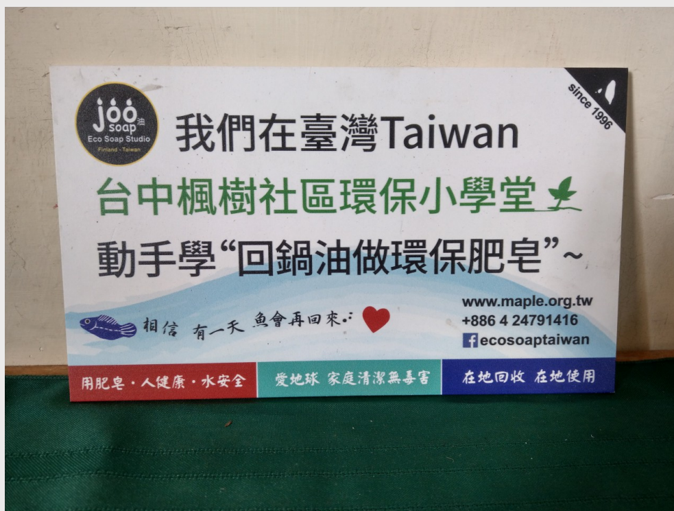
推廣楓樹社區「回鍋油做環保肥皂」活動的小看板。

2000年以前江鳳英致力於社區文化方面的保存與延續，而有鑑於行政院環境保護署推動的生活環境總體改造計畫，她決定著手創造環保與教育兼具的社區，於是開始帶領居民製造回鍋油肥皂並且販賣，獲得的收入便可以支持社區老人與弱勢團體。她也慢慢聯繫街友一同製作環保肥皂，給予他們衣服和住處，將之成立為環保肥皂教師團，街友們拿肥皂去販賣便可得到收入，靠人們消費的力量來解決社會與城市垃圾的問題。江鳳英說：「社區那些街友啊，社會局或是警察局只會趕他們走，並不會真正解決問題，身為一個教育工作者，就是希望將不良的社會邊緣人改變，期待這些舉動能夠讓街友們重拾自信，了解到這個社會並不是在處處打壓他們。」