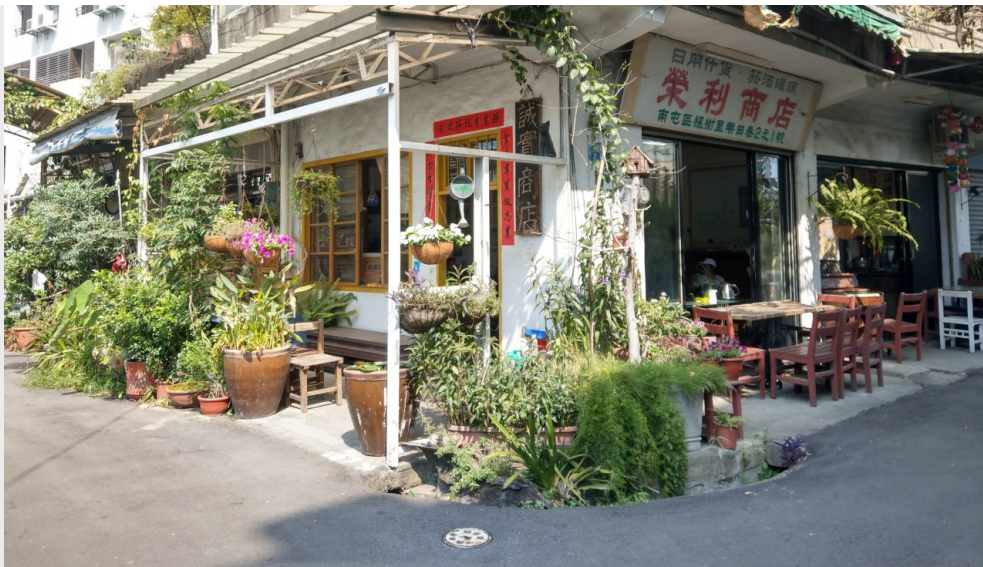
榮利誠實商店外觀。

但真的人人皆不偷不搶，心懷善念嗎？並沒有。誠實商店常因偷竊而虧損，江鳳英不難過反而生氣：「越是優秀的人就越會偷，誠實商店是教育孩子解決紛爭的地方，正大光明拿走東西的人也是偷，只是為了拍照打卡炫耀而來的人也算偷，偷誠實商店這個名聲，但卻不懂『誠實』精神。」但是她認為這都不是偷竊者的錯，是自己的錯，明明知道是有可能發生的，卻依然繼續下去。令她感到欣慰的是，居民聽見東西被偷之後，都漸漸主動幫忙顧店、打掃、澆花，更堅定了她不放棄的理念。