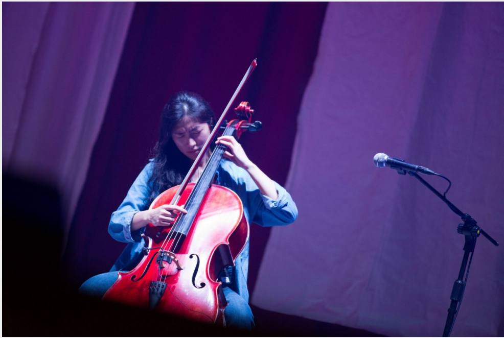
老王樂隊最與眾不同的大提琴配置。