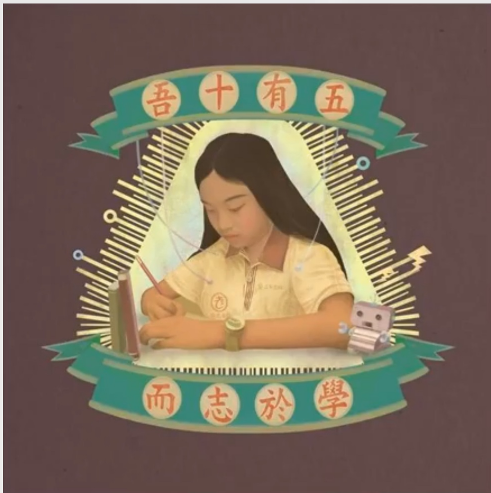
老王樂隊首張EP《吾十有五而至於學》專輯封面，採用復刻的懷舊感。

「前方路一條 / 認真讀書繼續考 / 穩定生活多美好 / 三年五年高普考」，這是〈穩定生活多美好 三年五年高普考〉中不斷重複的歌詞，創作的起因是一位因準備高普考而離開的團員。歌詞中用高普考呼應穩定生活，訕笑著那些因為不知道目標在哪裏，而把考公務員當作「讀書人生」最終目標的人們，間接的在歌詞中鋪陳他們對從小讀書、考試、升學環境的不滿；把「升學」這件貼近生活的事件灌注到歌曲之中，從主唱可高可低的特殊聲線中喃喃而出，對於那些曾有共同經驗的人來說，情緒是相當容易受到催化的。