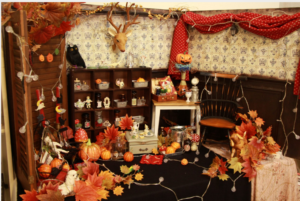
因應萬聖節主題所陳設的人形攝影佈景。

最讓她們引以為傲的是不定期舉辦的特色講座及活動，例如為時尚畢業生辦的講座，希望能去思考在現今產業裡面，在學的設計系學生及剛畢業正在找工作的人們，有什麼樣的需求，而她們及講者能提供什麼樣的知識及幫助；在人形玩偶方面，會因應節慶舉辦茶會或是手作工作坊等活動，讓人們也能動手製作玩偶周邊小物。不時也會與設計朋友們串聯，一起舉辦獨特的活動，希望能像英國、日本學習，辦些與工藝相關且風格精緻獨特的市集，讓人們能一看到就快速了解主辦單位、設計者的風格，例如以恐怖童話傳說——坎普斯作為主題的市集，跳脫以往台灣平凡溫馨的風格，走較獵奇的路線。