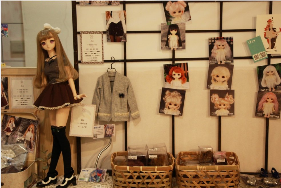
店內陳設的人形玩偶及配件。

的擺設、販賣通常是以一格一格租借給創作者的方式，例如台北車站曾出現的「格子趣」；然而，這樣子的展示方式由於未被分類、整理，使有獨特風格的人形玩偶顯得廉價、不起眼，於是她們選擇自行去尋找適合店內風格的創作者，主動邀請他們將作品展示在書館中，這種模式不僅增加作品的曝光度，也豐富了店內的風格。