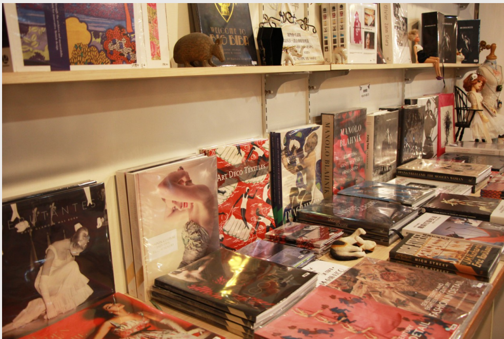
書櫃上陳列著來自不同國家、不同風格的時尚書籍。

「從接受度來看，台灣人幫自己設限的框框比較重，可能會在看到新東西出現時做出防衛。」於是她們開始從網路平台、粉專、網站做起，希望能分享一些有趣的東西、不同的時尚觀，開始做一些有趣的事情，挑戰大家的接受度。