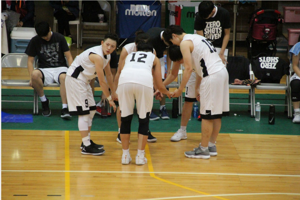
最後一節上場前台北市隊員互相加油。