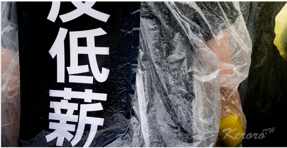
圖為「反低薪、禁派遣」大遊行之抗議標語。

同年，聯合國針對亞洲的青年低薪現象做研究。聯合國的國際勞工組織發表《 At work but earning less: Trends in decent pay and minimum wages for young people 》，宣告青年薪資折扣（青年薪資相對於成人薪資的低薪化程度）已成為世界趨勢。