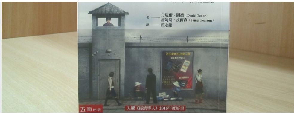
書本封面。