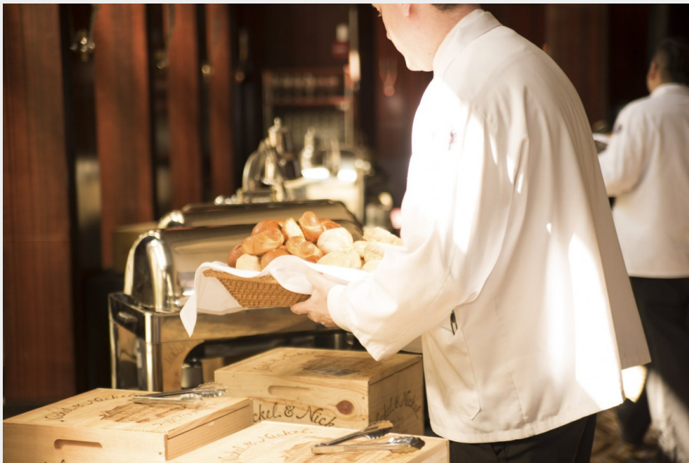
澳門的旅遊、服務行業發達，造成很多娛樂場、飯店的職位空缺。

由於台灣職業種類較多，幾乎每個科系都可以找到相應的職業，所以容易接觸到較多實作方面知識，同時也可以知道行業的發展動態，而澳門因地理條件因素，無法發展如此多元的產業，缺乏不同行業的就業資源，所以很多工科學生都傾向到台灣升學。