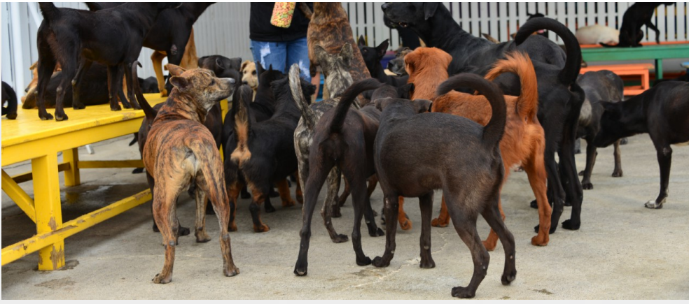
莉丰慧館假日開放給民眾與狗互動，餵食狗兒。

現今還有許多流浪動物的議題尚待解決，徐雯慧認為植入晶片才是杜絕問題的根本辦法，當問到希望民眾能夠為流浪狗做什麼時，園長不改樂天的個性笑說：「不要再抓寶啦，把這些時間拿來抓狗，帶狗狗出去走一走吧！」徐雯慧耐心的一步一腳印，堅持做別人不願意做的事，三千多隻狗才能獲得今天的照料，而她更繼續往前邁進，期望流浪狗關懷成為全民運動，邀請大家拋開所有顧忌，就算沒有能力養狗，簡單的陪伴對牠們就是一種很好的幫助。有空不妨去莉丰會館走走，或許也能獲得意想不到的美好體驗。