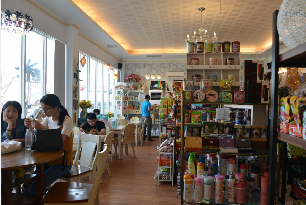
莉丰慧館內的可愛商店，附設座位供人喝茶休憩。

徐雯慧成為園長之前，曾經營日本進口零食商店，使她在設計園區時多了一分細膩，她了解環境的重要性，善用空間又不失美感。「我的理念就是顛覆大家對流浪狗收容所那種環境髒亂的印象」，莉丰慧館給人乾淨明亮的第一印象，可愛的標示牌提供參觀者資訊，使園區充滿了輕鬆愜意的氣氛，將充滿一千七百多隻流浪狗的園區，打造成動物與人的共同樂園。