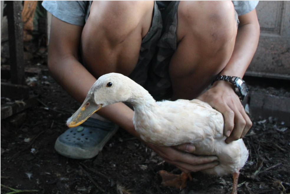
農場除了種植農作物外，也有養雞鴨，圖中這隻鴨的綽號為「醜小鴨」。

另一方面，從學生時期就鼓勵林帝延畢業後創業當農夫的大學老師，儼然成為他的最佳後盾，每當他遇到種植上的問題時，都會拍下照片並向老師請教，老師總是不厭其煩地回答，教導他正確的專業知識。在自身的不放棄和他人的協助下，林帝延的農場終於開始結出果實，可以定期銷出自家農作物並獲得穩定收入來源。