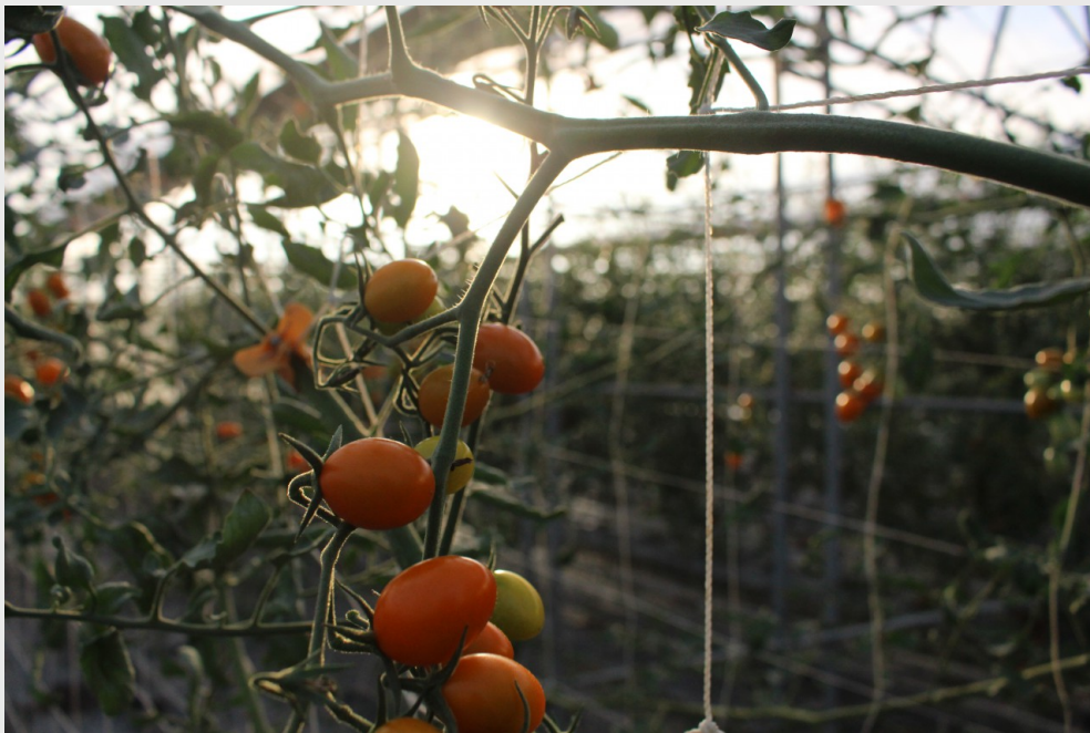
夕陽下的小番茄，看起來更為美味。

樹蔭底下乘涼休息，也因為嚮往這種怡然自得的農園生活，他有了畢業後自行創業當青年農夫的想法。