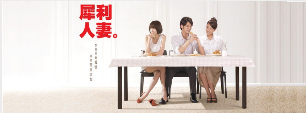
電視劇《犀利人妻》於2010年播出時，成功炒熱外遇話題。劇中第三者狡猾壞心的形象深植人心。

受電視劇影響，社會對於通姦的想像總是過於單一，軟弱不忠的丈夫、無惡不作的小三，以及善良無辜的妻子，此三要件構成一齣心碎的家庭悲劇。假使通姦除罪化，民眾最憂心的可能是許多受害元配的正義無從伸張，然而，台灣通姦罪的實際運行狀況，其實並非大眾想像那般，懲治了出軌的先生與第三者。