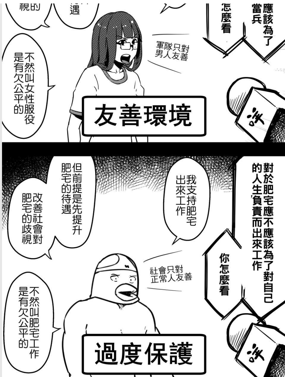
兵役一直是性別論戰中的爭議點。