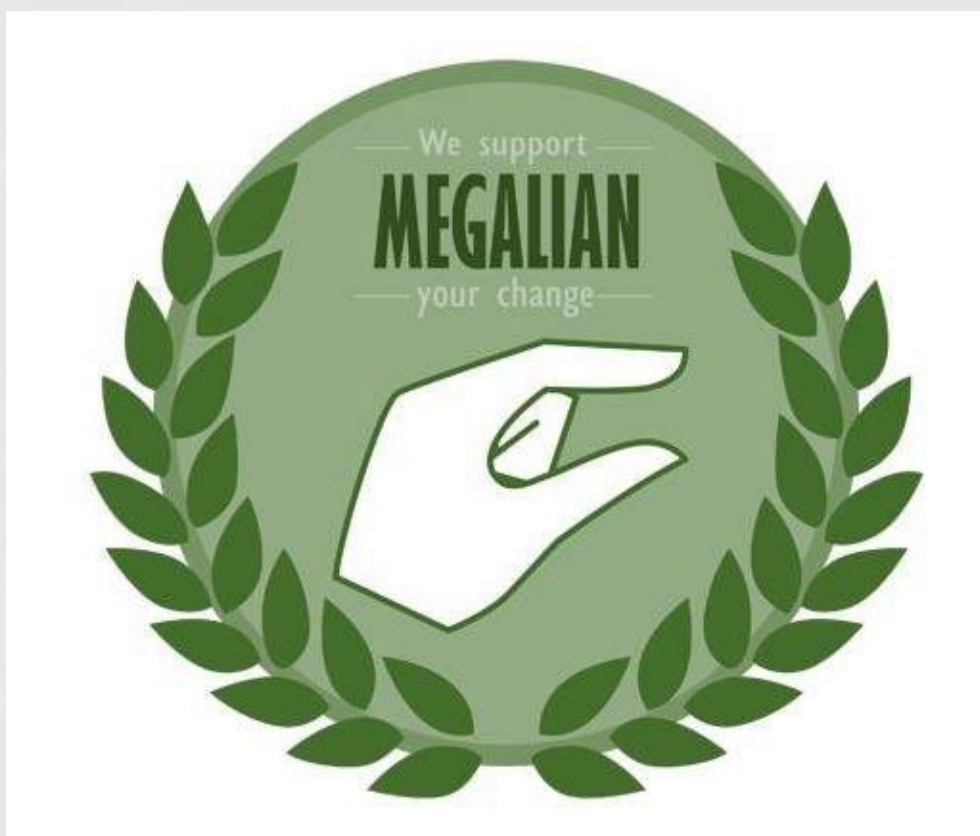
Megalia網站的LOGO中，暗示「小陰莖」的手勢。

1970年代韓國經濟高速增長，許多人擁有穩定的工作與高薪酬，能夠以一人的收入支持家庭運作。1990年代末期，亞洲金融危機打破了韓國上班族男主外、女主內的經濟模式，許多失業的男人開始與女性在職場中競爭。全球經濟的放緩更嚴重影響韓國出口導向型經濟，企業大量裁員造成家庭債務增長，加上韓國大學畢業人數遠超過就業市場，許多受過高等教育的人只能擔任臨時工，青年失業率更接近10%。年輕人、尤其男性將自己的狀況與父母輩的進行比較，往往感到十分失望，並將挫折感投射到女性身上。