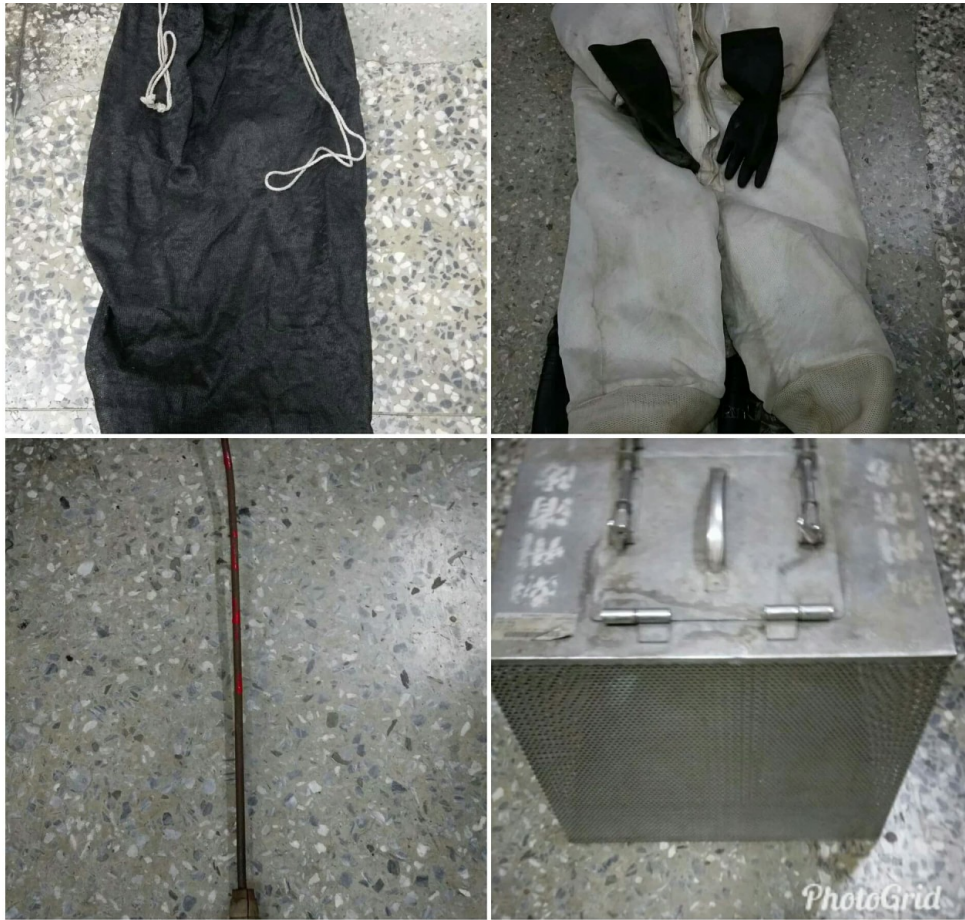
上面兩張從左至右為蜂袋與捕蜂裝備；下面兩張從左至右為多功能捕蛇桿和蛇籠。