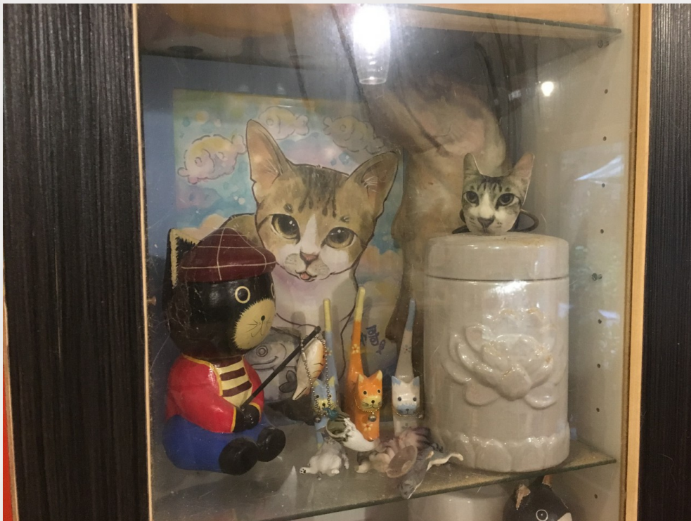
店內的一角放置著去世貓咪的骨灰。

談及經營帶來的喜悅，小可目光炯炯地表示，自己最喜愛的便是觀察客人與貓咪的互動，現今人們大多掩飾著真正的自我才得以於社會上生存，來到這裡，有了一絲喘息的空間，看著人們從拘謹變得放鬆，並自然地與貓咪說話，源源不絕的成就感於是產生，「我希望能讓那些帶著面具生活、心靈很漂泊的人們來到這裡，有一種回家的感覺。」小可笑著說到。