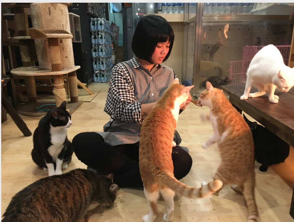
小可與簇擁而來的貓咪和諧互動。

回頭檢視坎坷的成長經歷，小可慶幸救援流浪動物使她並未誤入歧途：「我很感謝救援這件事情，它救了我一命，因為我在付出的同時，根本沒時間變壞！」將自己比擬做一隻流浪貓，她強調，自己或許拯救了牠們的身體，但牠們更救贖了自己的心靈，這為同為流浪者的彼此找到歸屬。如此的圓滿便是她內心所渴求，也促使她檢視生命的價值。