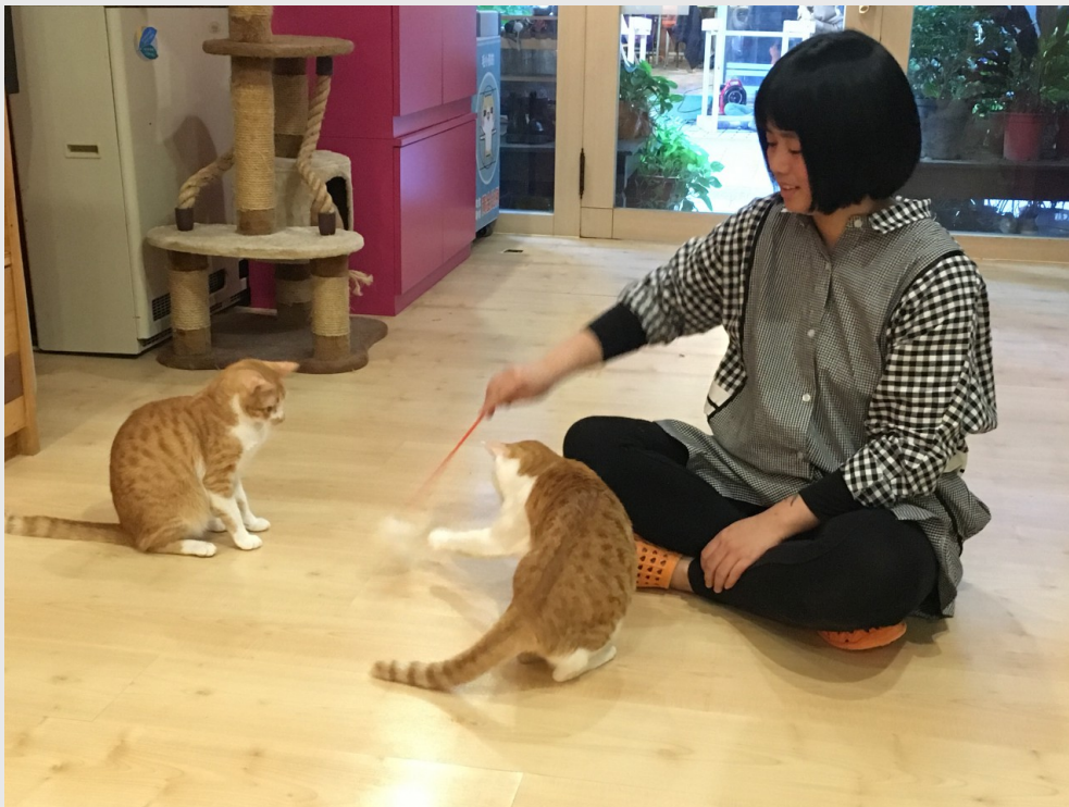
貓藝家提供一個可放鬆與貓咪交流的空間。

當救援的貓數量日漸增加，醫院已不堪置放，小可開始尋找一個既可讓貓咪安居，亦可使他們與人們友善交流的空間，而今日的貓藝家就此誕生。她提到：