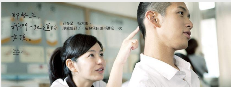
國片《那些年，我們一起追過的女孩》由美商《二十世紀福斯》發行。（圖片來源 / 《那些年，我們一起追過的女孩》粉絲專頁 ）

在台灣，美國電影每年市佔率為80%至90%，而國片只能排在剩下的檔期中；其中主要的原因和美國發行商（以下簡稱美商）與戲院協調放映事項時較具優勢有關。根據牽猴子整合行銷負責人王師在娛樂重擊上表示，預計十月上映的電影，美商六月就能確定上映的戲院，本土商卻要等到八、九月，也導致部分國片委託美商發行以獲得較高曝光率；《海角七號》、《那些年，我們一起追的女孩》等國人熟知的電影就是由美商發行的。