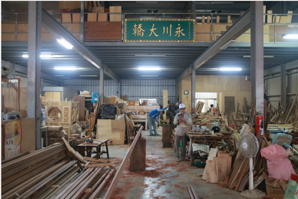
「永川大轎」工作室中，匠人們埋首工作的身影。

台南市神農街尾，靠近藥王廟的地方，可以聞到空氣中夾雜著陣陣的木頭香味。走近一看，放眼可及盡是木屑紛飛，匠師們各司其職，認真的做著手邊的工作，這裡是「永川大轎」的工作室。