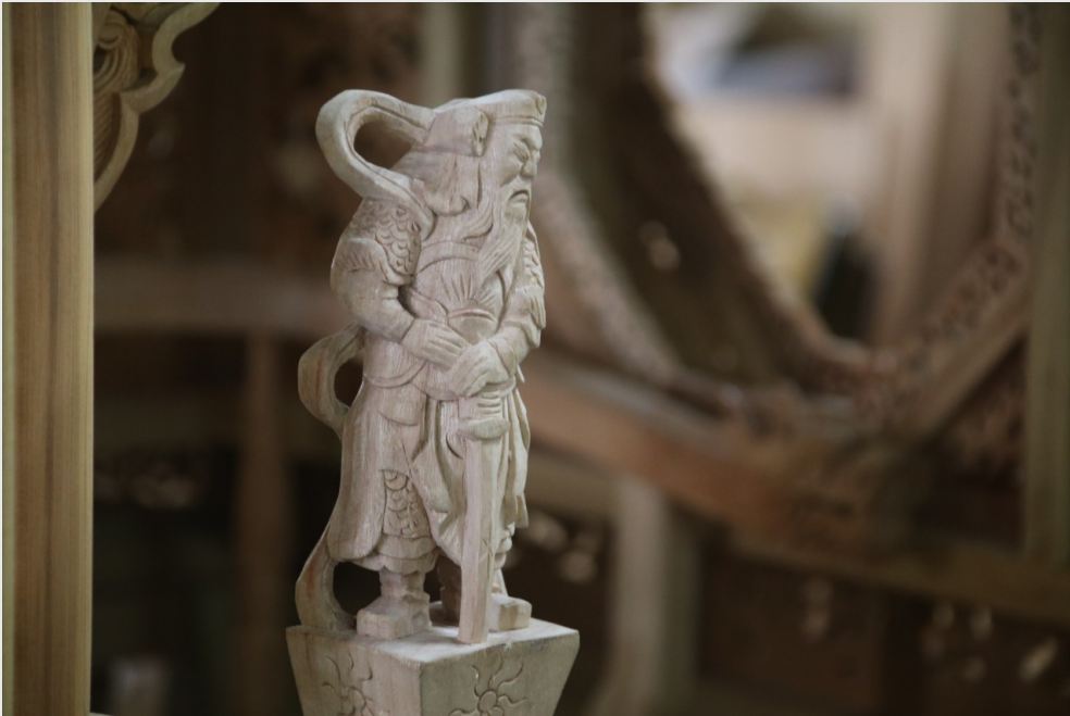
圖中的雕刻為「轎前尪仔」，為通過神轎製作的步驟所產出的成品。

神轎使用的木材大多以檜木、樟木和烏心石為主，選料指的是決定木材可使用的部位，並裁切掉不需要的部分。接下來，畫師將圖稿畫好，貼在裁切好的木材上，送去給鑿花師傅雕刻。鑿花師傅會先用雕刻刀打「粗胚」，將大約圖案與深度刻出來，再用雕刻刀把人物表情與花草紋路雕刻出來進行「修胚」。木作師則負責做好榫頭和榫孔，因為神轎用的是榫接的方式組裝各零件。在組裝方面，王永川特別強調：「這個關係最大啦。一頂轎子的木材大概有一兩百塊，如果不知道裝在哪裡的話，根本無法組裝。」