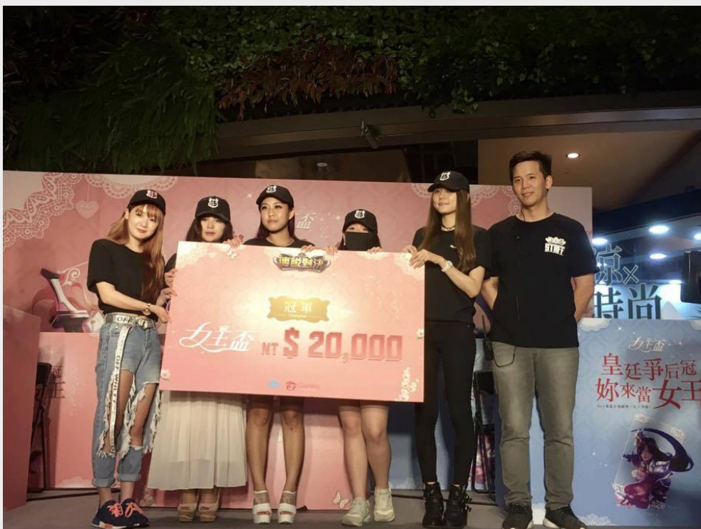
熱門手遊《傳說對決》於2017年5月舉辦了正規5v5競賽《女王盃》，其中MS怪獸在84個隊伍當中奪得后冠。

根據INSIDE的報導，Google在2015年的調查中，女性愛打電動的比例（52%）出乎意料地超過男性（48%），在台灣，除了女性玩家人數日漸上升之外，以電玩為職業的女性實況主、比賽主播也有增加的趨勢，雖然傳統大眾難免會有「玩遊戲是男生的專利」的想法，但不像其他運動會因男女生理差異而有先天實力差距，電競擁有讓兩性共同競爭的潛力。近年來電競產業蓬勃發展，但是在各個世界級賽事中，所有戰隊的成員幾乎清一色都是男性，雖然電競比賽主要的客群仍然聚焦為男性，男性對女性選手的刻板印象，是否也成為了在電競產業中阻礙女性選手發展的一個絆腳石？