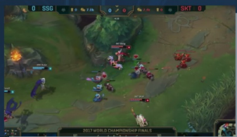
多人線上戰鬥競技場遊戲 (MOBA)