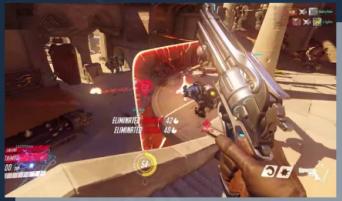
第一人稱射擊遊戲