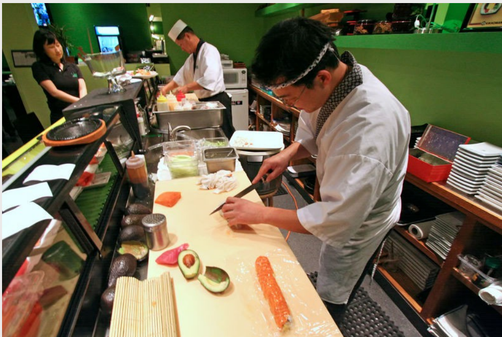
一般在壽司店難以見到女性壽司師傅。

在台灣，生理期的女性無法進香禮拜、碰觸宗教法器，要迴避動土開工等儀式；在日本，女性被拒絕在壽司師傅的殿堂之外，因為該行業相信女性在經期的味覺會改變；在馬拉威，經期來潮時不能夠與男性交談；在玻利維亞，衛生棉不能丟棄在一般垃圾桶，因為那樣會引發「癌症」與其他疾病，並傳染給大眾；在尼泊爾部分地區，月經來潮的女性要被隔離在月經小屋Chhaupadi，小屋大多無門窗、窄小，惡劣的環境導致許多女性命折於此。