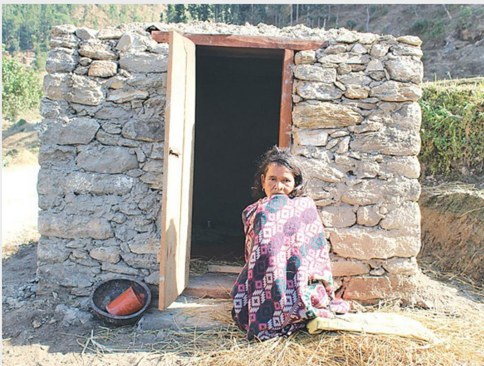
月經小屋Chhaupadi的照片。

在許多文化中，都有將月經來潮者隔離及不得性交的習俗。根據生物演化觀點，由於人類是隱性排卵的生物，不如其他生物有明顯的發情期，也無法得知何時性交能夠懷孕，因此提高性交頻率才能確保下一代的誕生。人們觀察到，月經來潮時懷孕的機率不高，在相對顯而易見的經期來潮時，就為了避免浪費資源，禁止人們性交。而為了確保女性不會「隱瞞」自身的經期，將女性隔離至小屋內，並用宗教、鬼神之說來恫嚇女性以達到目的。