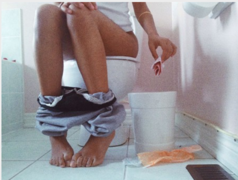
Rapi Kaur所創作的系列照片之一。

2015年3月，加拿大藝術家Rapi Kaur在社群軟體instagram上發布了〈月經〉(Period)系列生活藝術照，卻遭instagram以圖片不雅為由刪除，這引起了Rapi Kaur的不滿及網路的喧然大波，最終在輿論的壓力下，instagram表示為「不小心刪除」，這也引起思考，為甚麼月經不能被公開談論？