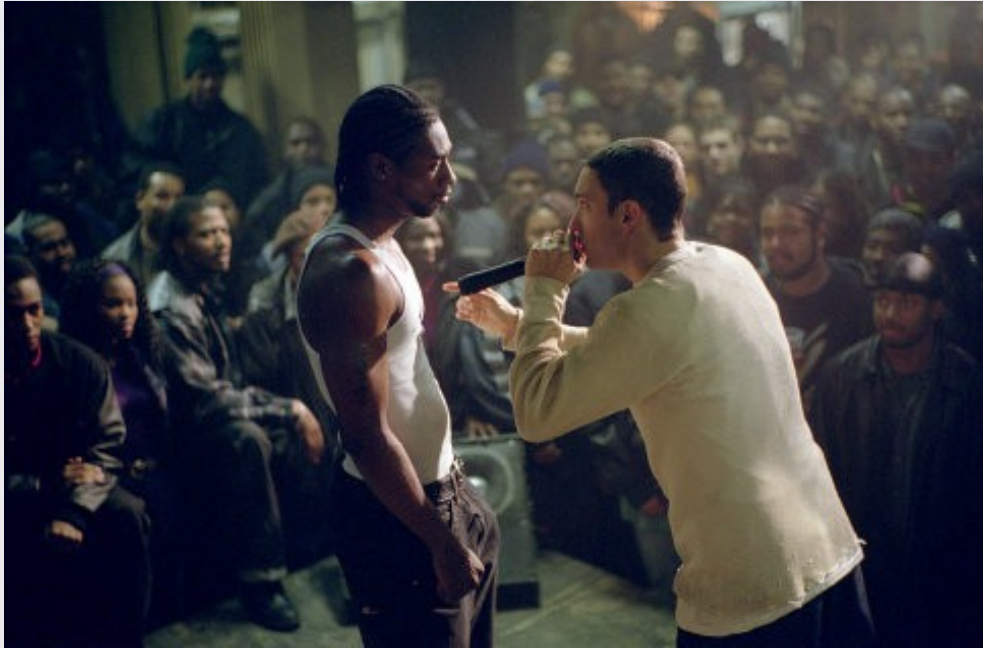
阿姆飾演的B-rabbit (圖右)，在饒舌battle中拿下勝利，受到全場黑人觀眾的讚賞。(圖片來源 / IMDb )