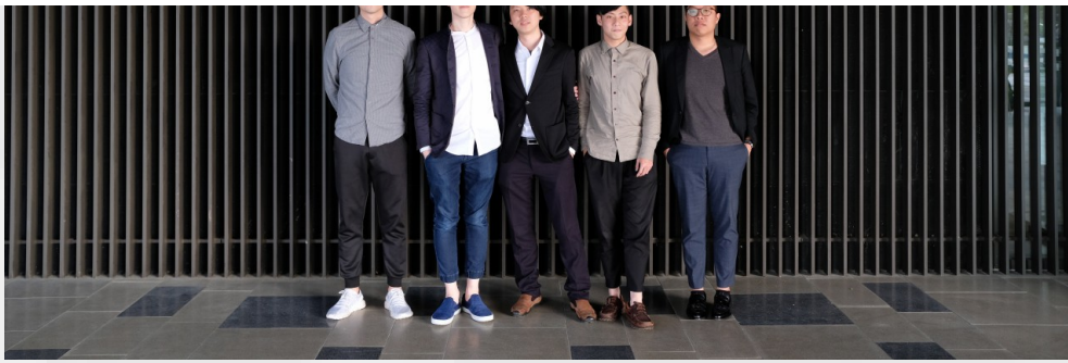
「Mr.block區塊先生」團隊成員。