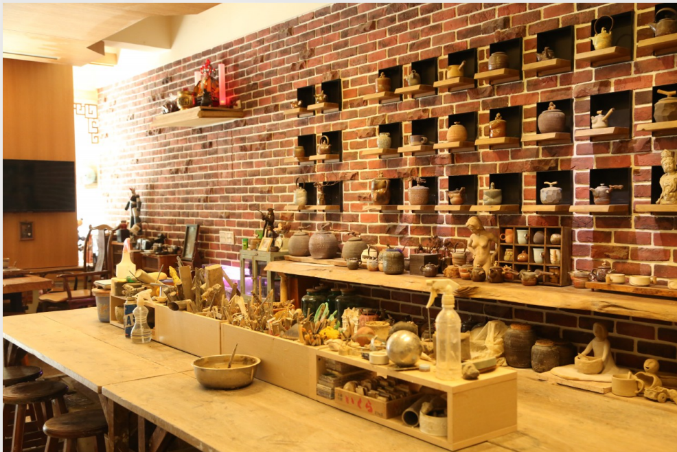
小小的工作室裡，大面積陳列擺放著許多平時創作的生活陶。

從原型雕塑轉移到陶藝創作的過程，林時植給予自己一個五年的停損點，假若五年內從零開始學習陶藝無成，就和現實妥協、放棄藝術的夢想。「人生很長，五年其實僅佔一小部分，趁年輕時候追求夢想，機會較大也不留遺憾。」這五年裡林時植大量的創作陶藝，積極爭取曝光機會，不僅慢慢建立起口碑，亦將內心沉積已久的創作理念爆裂式地噴發出來，找回那原屬於藝術家性格的自我。