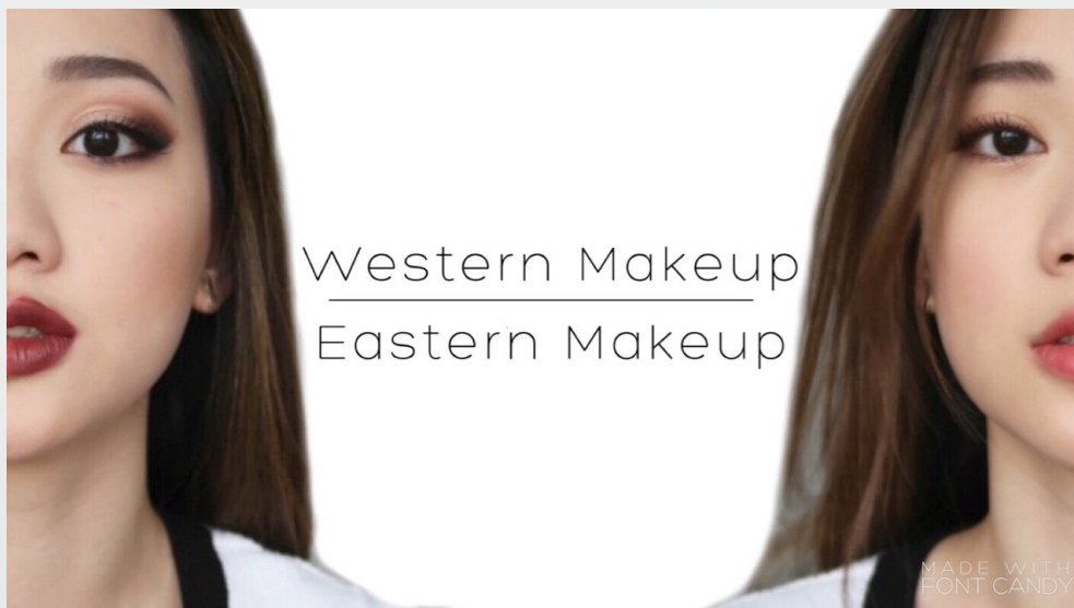
歐美妝容（左）與亞洲妝容（右）比較示意圖。

女性化妝與否、濃淡如何時常受社會主流價值影響，而相較亞洲的保守內向，歐美社會風氣較開放，對妝容濃淡的容忍度亦較高，若將歐美妝搬至亞洲，想必造成不小的衝擊，然而近年來不少亞洲族群開始向歐美妝容靠攏，漸漸的帶領起一股欣賞濃豔妝容的風氣，這點對社會多元化無疑是好現象，顯示在時代進步的洪流中，人們願意敞開心胸，接納與認知大相徑庭而新奇的價值觀。