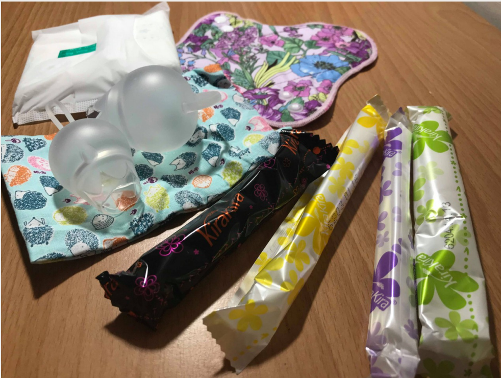
各式市面上可見的生理用品，由前至後分別為棉條、月亮杯、衛生棉與布衛生棉。

而後徹底改變使用習慣，從百分百的「衛生棉女孩」變成「棉條女孩」，則是大學四年級出國交換的時候。國外多樣的選擇、方便的取得，讓她完全愛上棉條。這兩階段的經驗，成為曾穎凡邁上了創業之路的契機，透過自身的經驗，她明白要讓女生接受棉條需要兩個「橋」，第一座橋良好的使用體驗，而第二座橋是購買的方便性，只有築起這兩道橋，台灣的女生們才有機會「上岸」。對她來說，台灣整體的環境就是無法買到棉條，因為自己也買不到，她知道這樣下去棉條永遠都無法普及，索性跳出來自己創業。