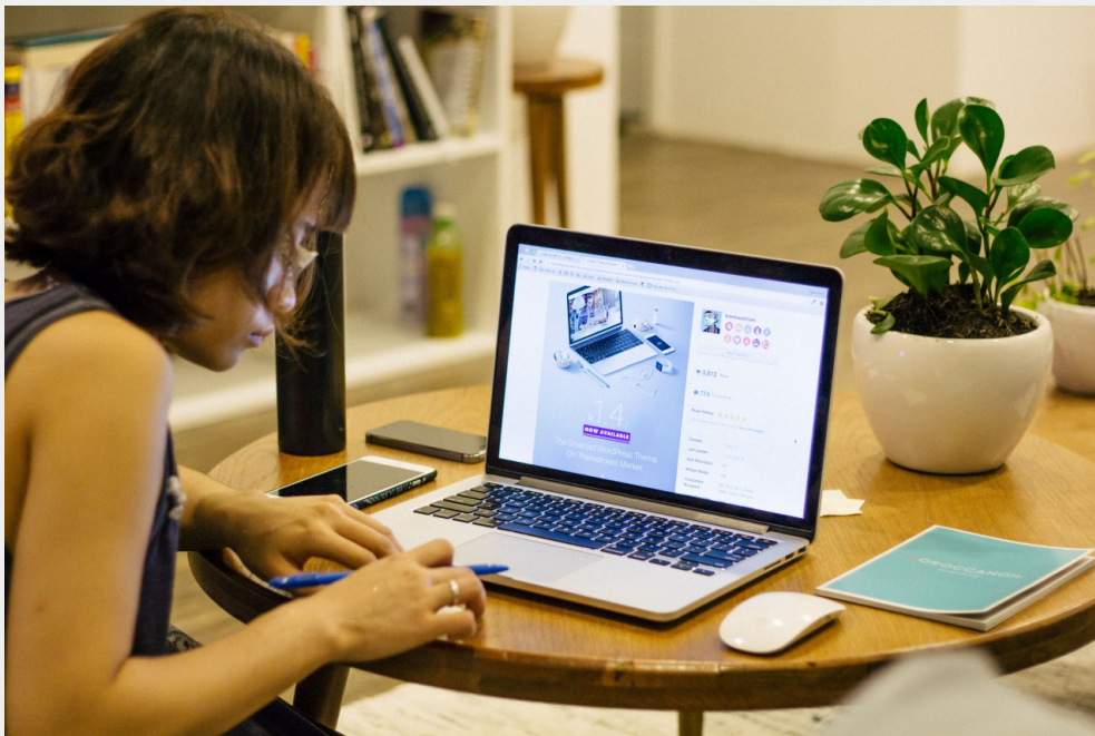
馬來西亞學生普遍覺得台灣學生勤奮、努力學習。

談到馬來西亞與台灣學生的分別，他們都對於台灣學生的自覺和用功感到驚訝。Joey表示一來到台灣時，每晚都會看到其他室友在複習和預習課程內容，令在看韓劇的自己感到很慚愧。而受訪者小白也覺得台灣學生都能很專注在學習上，一當開始學習後就可以堅持很久，不像自己輕易就受誘惑分心，可能是從小開始培養出來的習慣，是值得自己學習的方面。