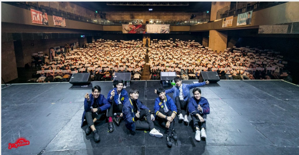
泰劇《一年生》來台舉辦粉絲見面會，在台上與粉絲拍攝大合照。

除了透過追劇能看到男男情侶互動，近幾年不少泰國同志劇也開始舉辦海外見面會，像去年席捲全亞洲的男同劇《逐月之月》及《一年生》都在去年和今年來到台灣舉辦演員見面會。Tiffany表示在看劇的時候常常會陷入男男情侶的魅力，因為很喜歡看他們相處。特別是劇的幕後花絮，因為會對花絮中兩人的互動很有興趣，觀看後發現劇中的男男情侶在現實中也很有愛的時候就會覺得滿足。正是因為這一點，不少迷群便會選擇買票到現場，只為一睹真實的男男主角在他們眼前互動。參加過《逐月之月》與《一年生》見面會的毛毛便透露當看到真實的男男情侶在他眼前放閃的時候，那種感動真的是不可言喻，因為有一種他們已經不只存在於劇裡，而是真的、活生生地走出來了。