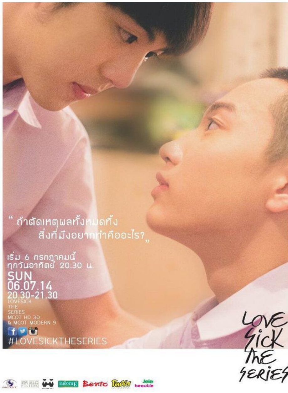
《為愛所困》劇照，男主角Pun與No的禁忌之戀，眼神透漏濃濃愛意。

接下來在2015年，導演Chookiat Sakveerakul以《沒有真相的內心秘密》出擊，內容為男大生、空服員及醫生因性向混亂而造成的同性三角戀，雖然最終以悲劇收場，但仍順勢搭上這股男同熱潮，順利造成轟動，而後同樣也推出了二部曲。自此之後，泰國男同劇便不斷推陳出新，屢次都引發熱議，不僅培養了忠實迷群，甚至也造成中國、台灣爭相仿效。但比起中國男同劇因為國家因素導致劇風較為保守、台灣的情感表達相較之下稍嫌內斂，泰國的男同劇帶著熱情豪邁的情感呈現方式依舊廣受喜愛。