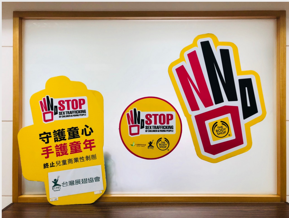
展翅協會的會議室牆上，張貼著防治兒少性剝削的大字板。

展翅協會一直在倡議台灣應從行政罰提升為刑事罰，目前許多國家如歐盟、美國、英國、日本等皆已規範為刑事案件。但台灣在法律政策的推動上還是困難重重，如何讓政府、立法者以及執法者去了解，就算是單純持有這些圖像，對兒童仍然有很大的傷害，應該以刑事罰處理，成為展翅協會致力推動的目標。