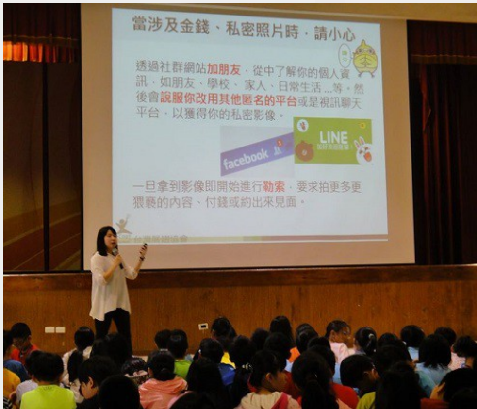
台灣展翅協會進入中小學進行上網安全宣導。

最後，家長以及老師為教育防治性剝削，扮演重要的角色。陳逸玲提到家長、老師與孩子往往有數位落差，不同於傳統定義的數位落差，這邊則是意指孩子熟悉使用網路、3C產品或新軟體的能力有時候超過家長跟老師，這時候家長跟老師也應該去了解孩子用的網站或應用程式對孩子可能存在甚麼風險，並且從中去培養孩子網路安全的意識。