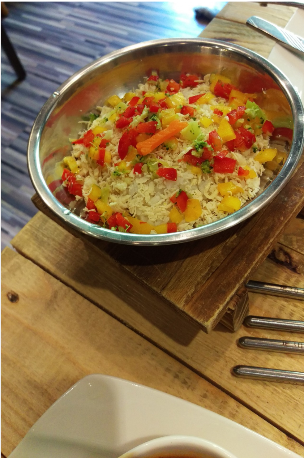
寵物旅館會料理適合狗狗飲食習慣的鮮食，並提供良好照顧。

綜觀以上現象，雖然目前國內的寵物保險產業，尚未像國外蓬勃發展，但寵物與人們的關係日益密切。未來若有更完善的規劃以及配套措施，相信飼主們與毛寶貝們也可以享有更高品質以及更有保障的生活。