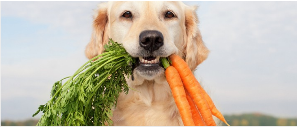
給寵物狗、貓吃素一直是一大爭議