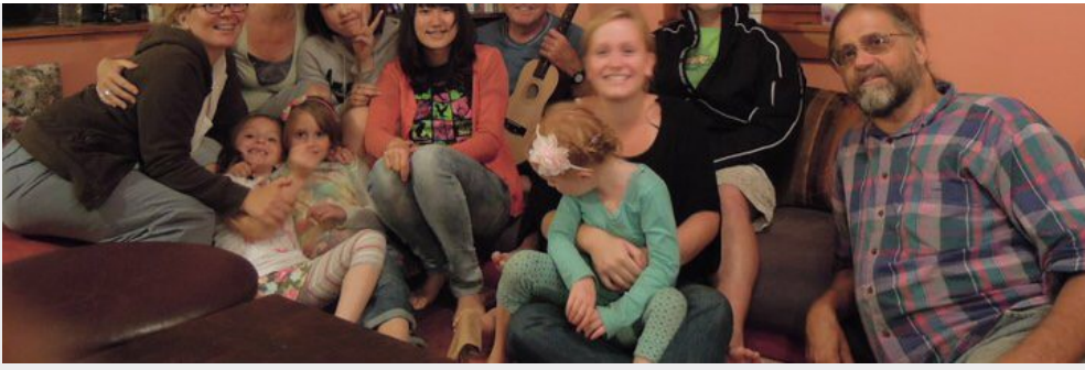
窮遊女子在美國打工換宿時，和雇主一家人相處得十分融洽。

跳脫舒適圈之後，不僅既有的觀念受到全新的啟發，也讓窮遊女子更認識自己，找到自己所熱愛的事物。她表示，當時就讀中文系的她對於未來感到迷惘，在美國的期間，她時常趁著空閒之餘四處遊玩，意外發現自己對攝影有著濃厚的興趣，也很喜歡和別人交流、聆聽別人的故事。回台灣之後，她加入攝影社繼續增進攝影實力，同時也擔任校園記者，負責撰寫人物專訪，出社會後接連的幾份工作，雖然和這些興趣沒有直接的關係，卻有著巧妙的連結，都是和與人溝通、互動相關。