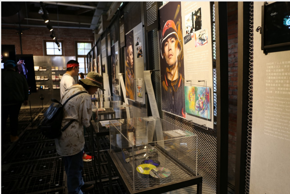
「嘻哈團Taiwan Hip Hop Kids」特展中，擺放饒舌歌手的介紹展板以及歌手們提供的私人物品供大家參觀。

去年「中國有嘻哈」節目的播出，以出色的節目腳本安排將選秀節目劇情化，吸引了超過20億的總觀看人數，讓嘻哈文化中的「饒舌」曝光於螢光幕前，也提升大眾對於饒舌歌手的關注，但節目名稱所提到的「嘻哈」文化，其實包含了更廣大的文化內涵，而非僅止於饒舌而已。台灣一間知名饒舌廠牌在今年四月舉辦了「嘻哈團Taiwan Hip Hop Kids」特展，集結四間不同風格取向的饒舌音樂公司，以複合式媒材呈現了台灣饒舌的發展，也介紹從早期一直到當代的各家饒舌歌手，展覽內容包括：以液晶螢幕播放著饒舌歌手的影像紀錄與訪談內容、百大專輯牆、擺放歌手的一項具特色的代表性物品等等，然而，同樣打著「嘻哈」之名，展覽卻也僅止於「饒舌歌手」的範疇。