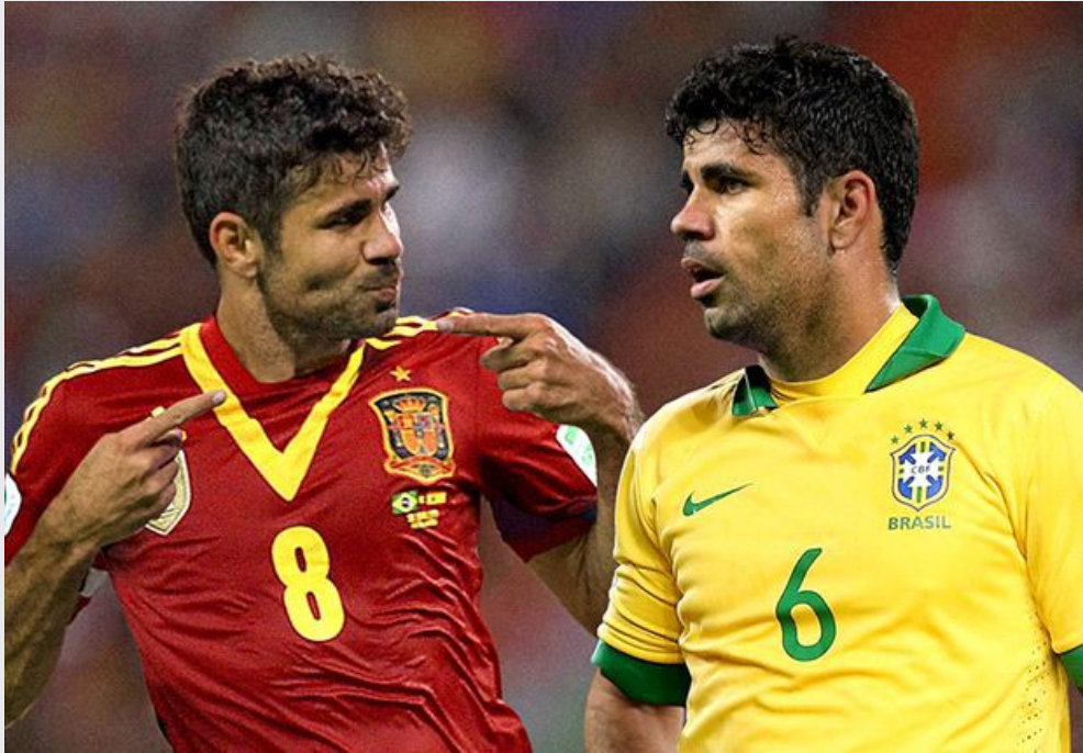
名將Diego Costa於2014世界盃代表西班牙出賽，卻也曾在同年巴西國際友誼賽代表巴西。

這些球員被非自己土生土長的國家相中，無疑都是因為擁有優異的能力，而球員得到的便是雙重國籍、更好的居住環境、出賽和奪獎機會、優渥的薪資等等好處。然而世界盃之所以為全世界瘋狂，便是因為四年一次球星紛紛回家為自己的國家爭光，全國齊心向同一個目標邁進。利用歸化球員增加國家隊奪勝的機率，難免讓人懷疑是否違反了國家隊的真諦，宛如職業聯賽的形式，降低了觀眾與國家隊的歸屬感呢？