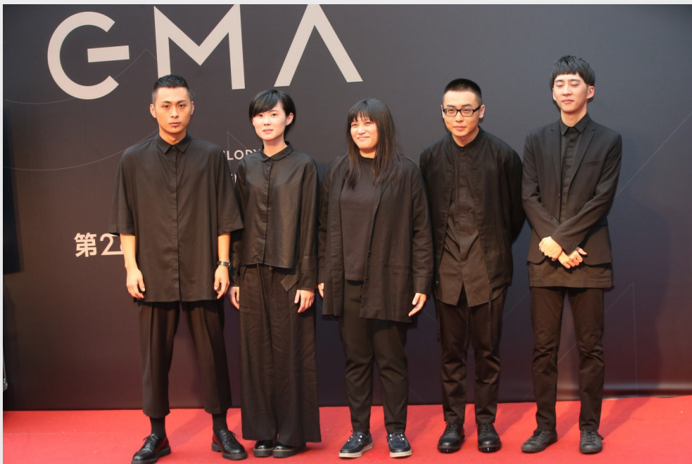
草東沒有派對近年因金曲獎而備受矚目。

獨立樂團的創作題材，從土地保育、個人抒發到社會議題，多元性高且反映社會真實面貌。這個世代的年輕人，特別是千禧世代，對於獨立樂團有深刻的認同感，他們藉由這些歌曲宣洩內心的壓力，在音樂中找回自我。