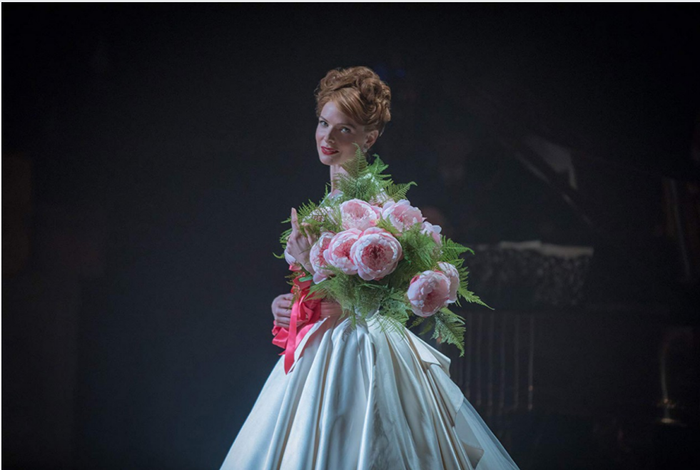
珍妮演唱的《Never be enough》反映巴納姆渴望上流人士的認同

儘管馬戲團日益成功，讓他們住進豪宅，學習昂貴的芭蕾舞，但女兒卻因為身分問題被同排擠，讓巴納姆開始渴望得到上流人士的青睞，他極力邀請「瑞典夜鶯」珍妮來美國做巡迴演唱，去證明自己不只能辦出被大眾形容是雜耍的表演，而是能被稱為藝術的表演。而珍妮在歌曲《Never be enough》當中便唱到：“These hands could hold the world but it'll never be enough”，除了反映巴納姆內心當中的空洞：即使現在已經擁有了可觀的財富，但仍絲毫不滿足，出身貧賤的他，轉而希望追尋上流人士的認同。