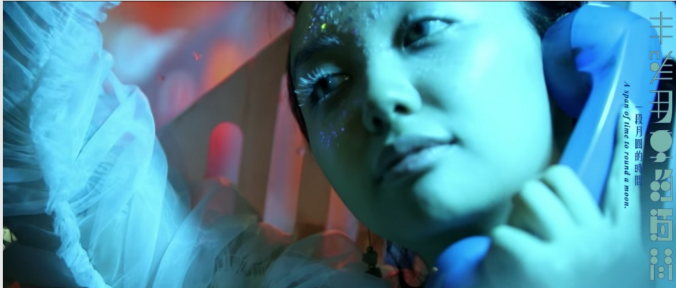
「一段月圓的時間。」

古卻也摻著科技感，結合迸發奇異時尚感、俗氣美口口等新滋味。此種風格在另一首歌《米兒Mia》中尤其明顯，如具科技感的服裝、眼鏡，並結合一些較復古、霓虹色調的場景。