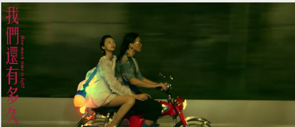
「我們還有多久？」（圖片來源 / 美秀集團《小老婆Little Bitch》MV截圖）

不得不說我很喜歡這樣的安排，漸進式的情緒推進使整首歌曲頗有層次。聽眾在歌曲開頭，多少還對大老婆的帶有一點愧疚和背德感，但從第二段開始，就如同外遇的主角，已深陷其中、坦然享受偷情的滋味，腦中只剩催眠般的歡愉。慢搖滾結合民謠的曲風與主唱魔性的唱腔有種奇妙的搭配。《小老婆Little Bitch》屬於第一次接觸不甚習慣，卻會越聽越上癮的歌曲。