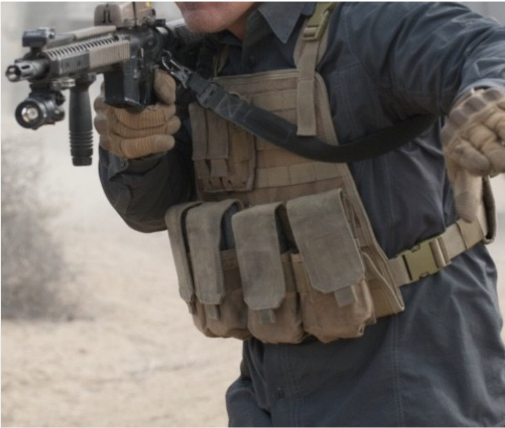
特工麥特殺人不眨眼，卻也有著自身的無奈。

殺戮、暴力雖然在好萊塢電影裡隨處可見，但它們的目的多半是為了達成其帶來的娛樂效果或者視覺張力。《怒火邊界：毒刑者》中，並無多餘的槍戰、對峙戲碼，子彈在擊發的瞬間往往人頭已經落地。這些「行刑」式的槍響不是為了電影的娛樂效果存在，而是透過視覺震撼點醒我們看清現實的殘酷，生命的消逝在毒品戰爭中是多麼稀鬆平常、多麼的一文不值。不管是特工、邊境軍人們或是毒梟份子皆深陷於灰色的道德瑕疵中，他們時時刻刻都面對著這些殘酷真相，難以脫身，相對於身為幕後黑手的政府高層卻往往能置身事外，更顯得諷刺。