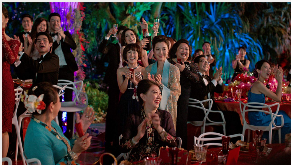
傳統的酒席顯現出亞洲富豪們奢華的大排場。

電影中也多次提到亞洲人重視傳統的觀念，像是全家人一起在餐桌上包水餃的場景。包水餃的口訣和技巧都是代代相傳的，如果傳統不延續下去就會消失。這樣的價值觀不時穿插在電影中，表面上看似一般亞洲家庭的習俗，但對於從小接受西方教育的瑞秋來說，這些傳統好似時刻提醒著她不是屬於這裡的一份子。電影透過這樣的闡述，詮釋了種族文化的衝突與隔閡，讓觀影者能去思考這些矛盾的價值觀。