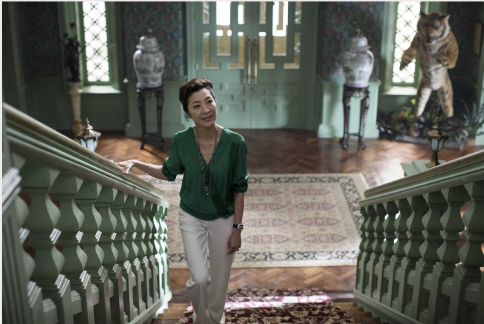
虎媽背後也有不為人知的苦衷。