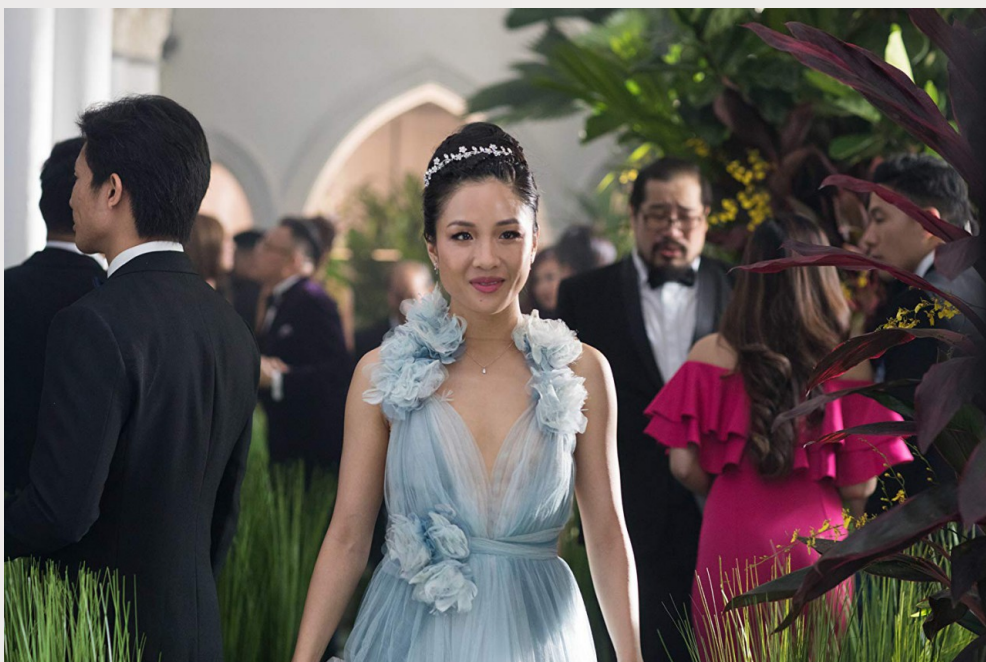
自信才是讓別人尊敬你最重要的一點。

瑞秋的另一個考驗是被譏為沒價值的「香蕉人」，意思是「黃種人的外表，白種人的思想」。她跟著尼克回到新加坡，成為大家茶餘飯後的話題。尼克是當地有名的黃金單身漢，瑞秋和他在一起不免遭人眼紅，大家自然對她很不友善，更有人猜測瑞秋是為了密謀尼克的家產而和他在一起。但是受到各種欺侮的瑞秋並沒有因此像膽小鬼一樣落跑，聰明的瑞秋最後想通了，其實重點不是要讓尼克的媽媽喜歡他，而是要讓她尊敬自己。