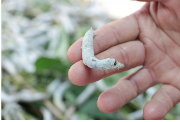
蠶寶寶共有五齡，五齡蠶時期食桑量增大，體長可達6至7公分，準備吐絲。