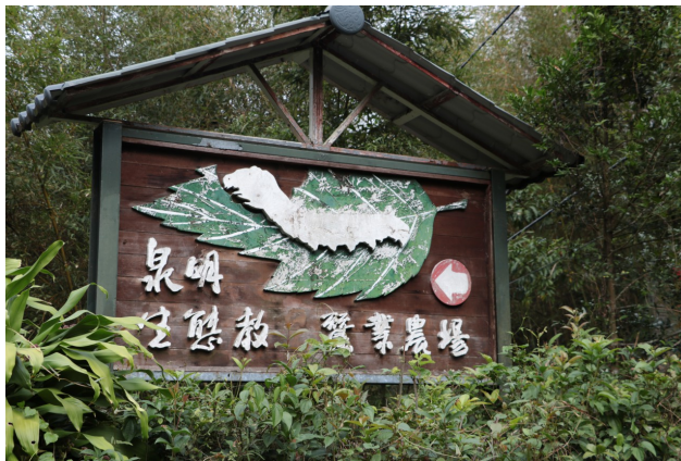
苗栗縣獅潭鄉的泉明生態教育蠶業農場，是現今全台灣唯一的蠶戶。

在養蠶之前，涂泉明做過很多工作，從山上砍竹子、砍樹，到鐵路電氣化時的工人，只要能賺錢的工作都做。直到民國67年，政府開始推動蠶業，那時苗栗縣農會派指導員向農民教學，獅潭鄉有三十幾位農民開始著手學習養蠶。涂泉明和太太經過全盤考量，認為蠶繭有公定價格，有收入保障，也可以妥善利用爸爸的田地，便決定接了這個產業。