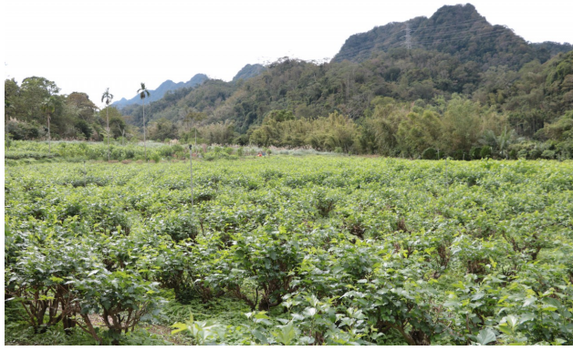
獅潭依山傍水，給桑樹良好的生存環境。