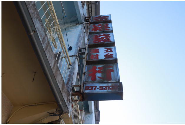
開業超過五十年的金松發五金行販售常見的家庭五金， 也是村民需要水電服務時的去處。