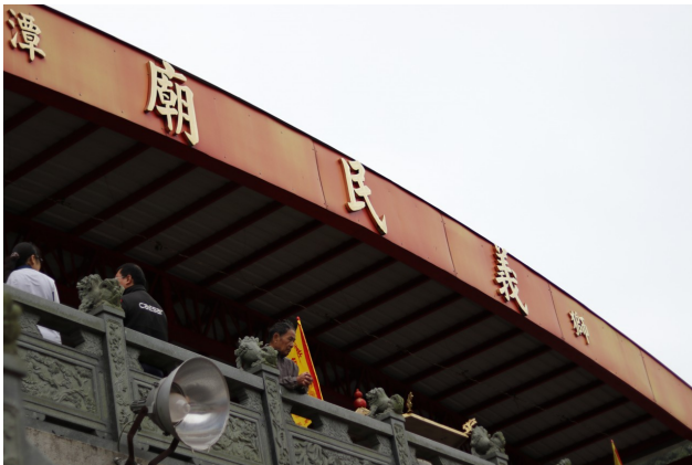
改建過後的義民廟，一樓為禮堂，二樓為奉祀主神義民爺的主殿。