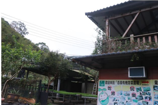
圖為百壽芽菜有機農場大門。

邱政光是百壽芽菜有機農場的負責人，在2016年11月從外地回到家鄉接手農場。邱政光是獅潭鄉土生土長的客家人，從小便跟著爸爸種植芽菜的他，對他來說，農場的作業與其說是工作，不如說是一種生活，顧慮到父親要退休，想讓爸爸的芽菜王國維持下去，邱政光放下自己在餐飲店的工作，回到獅潭鄉與姐姐一同經營農場。