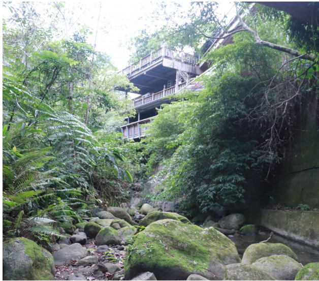
圖為由百壽芽菜有機農場底下的小溪向上拍攝。