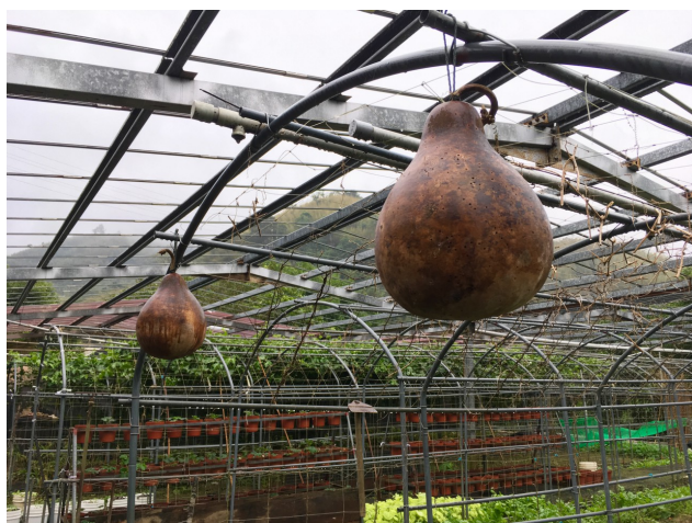
李欽祥農園種植的展示型南瓜。

當時，苗栗縣農會提供李欽祥南瓜種子，李欽祥比誰都還有幹勁，經由他一手用心的栽培，日後竟培養出高達五、六十種豐富樣貌的特色南瓜，包含了重達八十公斤的巨型南瓜、小巧可愛的裝飾南瓜，以及各式不同顏色的南瓜。民國93年，許多媒體因而來此採訪、廣為宣傳李欽祥種植的「展示型特色南瓜」，甚至舉辦過南瓜個展，誤打誤撞的闖出了造型南瓜的名號，多元豐富的物種也成為123的家引以為傲的特色。