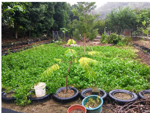
夏季將會吸引蝴蝶來此群聚的光葉水菊。

隨著人氣的高漲，李欽祥卻沒有因此自滿，反而更堅定追求要讓更多人看見獅潭生態之美的理念。他利用了農園一旁的空地，種植吸引蝴蝶群聚的光水菊及蜜源植物，李欽祥說每年五、六月的夏季，便會吸引上百隻向南遷徙的氏紫斑蝶在此駐留，蔚為奇觀。除了注重果樹的栽培之外，更重視自然生態的共存，讓在此生存的植物與動物得以達到和諧的生態鏈，並以友善環境的方式，維護乾淨的水源、純淨的土地，打造出動植物之間的平衡美感，保存獅潭最珍貴的原鄉生態。