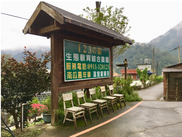
123的家之招牌。(許庭瑄 / 攝)

對於農地耕作，僅依存著兒時記憶的李欽祥，藉著與農會的合作契約，種植了洋菇、木耳、茶葉等經濟作物，在每次栽種過程中，不斷的學習如何與作物相處、與環境共存，也越來越明確自己想發揚故鄉這塊土地的想法。民國81年，李欽祥便向農會爭取到觀光協會的補助，開始朝自己心目中經營的農場前進，「123的家」便因此誕生。