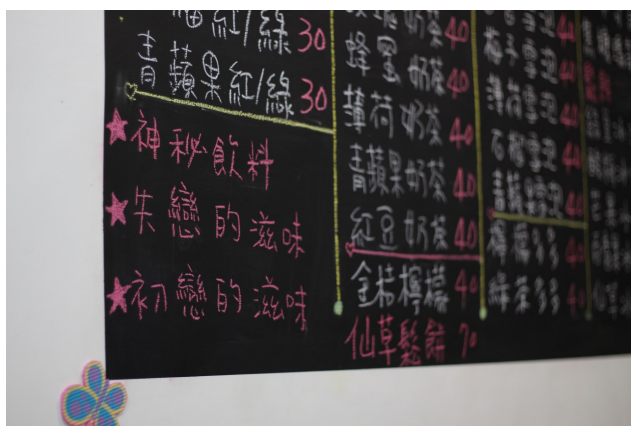
特殊的菜單讓顧客也摸不著頭緒。

除了咖啡之外，店內也有各式各樣的飲料，有些是沿用水頭咖啡的老菜單，但林玉燕同時也增加了許多不一樣的特色商品，例如結合獅潭當地有名的仙草鬆餅與仙草冰沙便受觀光客們的歡迎。喜歡嘗試的她也不斷地創造新產品，有不讓客人知道原料的神秘飲料，還有自家手工製作的布丁凍等等，林玉燕說：「也不知道效果怎麼樣，先賣賣看再說。」