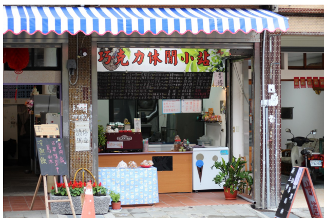
巧克力休閒小站外貌。

東也支持他們在獅潭開設不同老街以往的店家，因此獅潭鄉唯一一家飲料店「巧克力休閒小站」便就此開張。