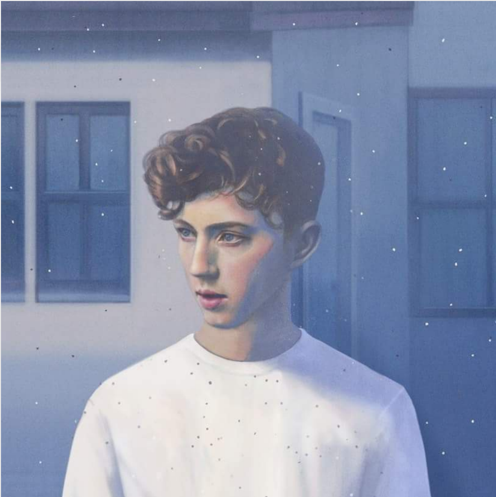
《藍色年少》的專輯封面。

三部曲的最終章，是個悲傷的結局，雖然在故事中阻礙戀情的父親過世了，但他的愛人最終也選擇了自殺。