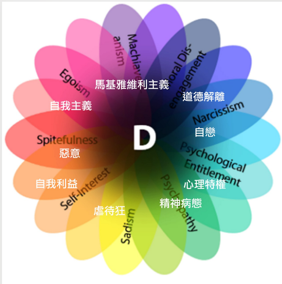
D因素之九大黑暗人格特質。

的快樂或優勢。「馬基雅維利主義」，象徵政治上為求成功而不擇手段，不惜在人際關係中使用詐欺和欺騙的行為，且缺乏常規道德的關心。「道德脫離」，意指說服自己，自我的道德標準並不適用於一特定環境中。