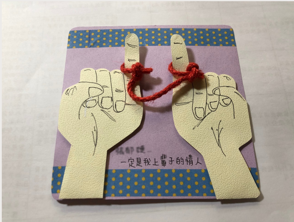
好朋友的生日卡片，想像有一條紅線將我們綁在一起。

週也有所不同。這是一張送給就讀博雅科系朋友的生日卡片，靈感他說起等演夢，以電影膠卷為發想，期許我能成為他人人生電影裡的片段，和他一起經歷的點滴都能收錄其中，成為最美好的記憶。