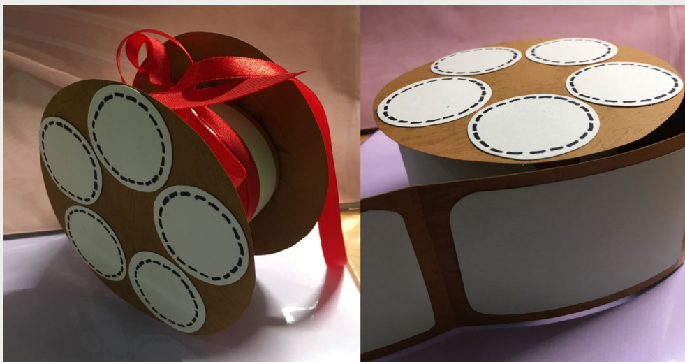
傳播科系朋友的生日卡片，以電影膠卷為模型創作。

如獲一摯友，此生足已，朋友是我們除了家人外最珍貴的寶物。對於身邊的每一個朋友，我會依據每一個人的特質，為他們量身打造專屬的手工卡片，背後的意涵也有所不同。這是一張送給就讀傳播科系朋友的生日卡片，願他前途遠