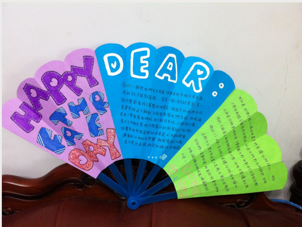
父親節手作卡片，以競選扇子為原型創作。

這一份手作卡片是我最得意的作品。父親節正值選舉當季，路上總有源源不絕的競選扇子和衛生紙，看著這些資源濫發，我靈機一動將上面競選的照片拔下，留 國立交通大學機構典藏系統版權所有 Produced by IR@NCTU