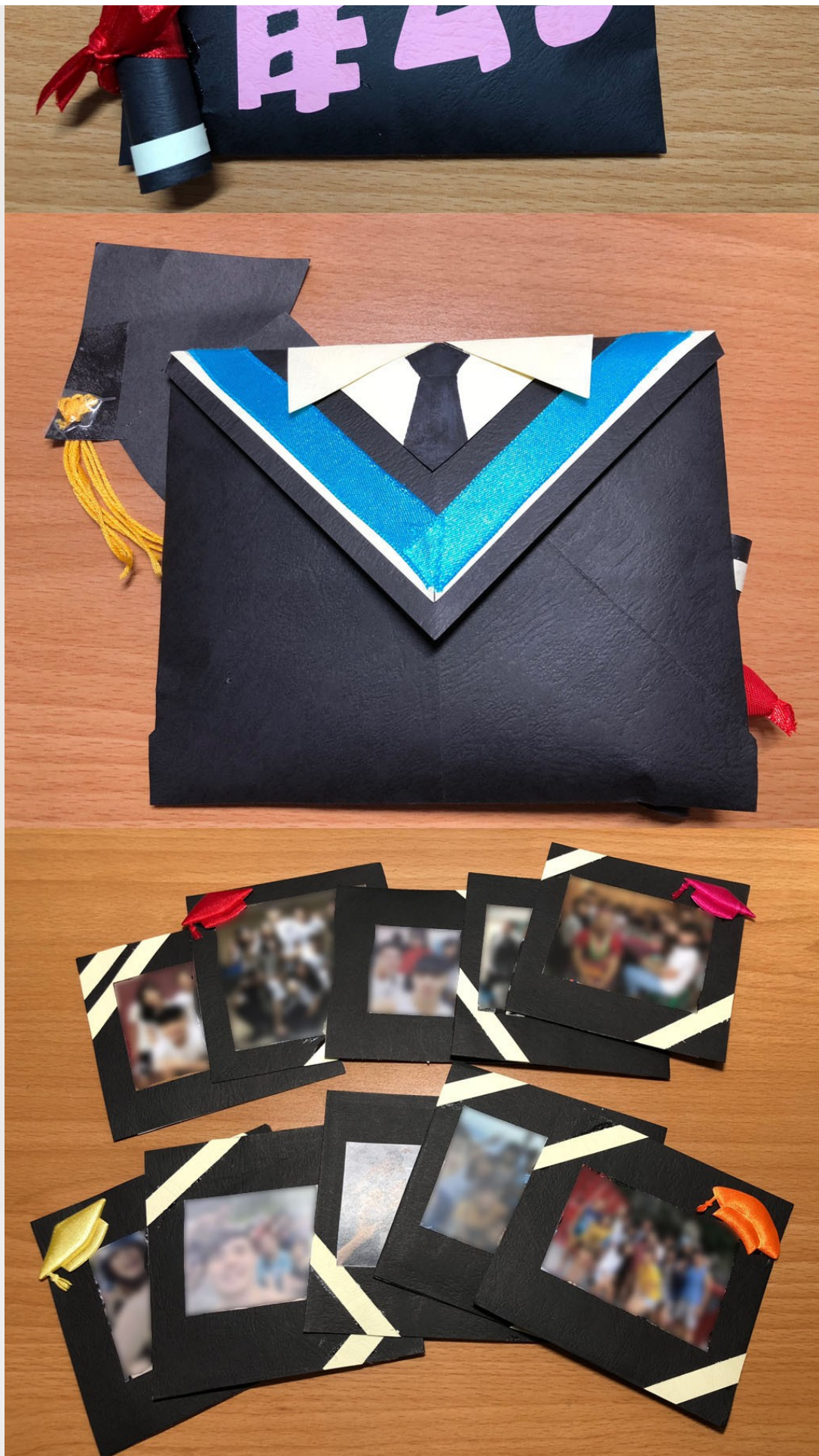
活動組畢業祝福卡片。