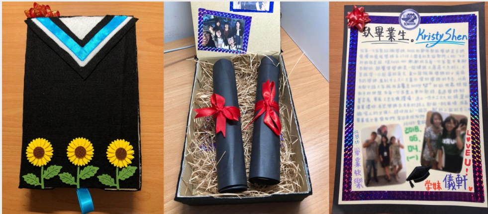
直屬學姊的畢業卡片。

傳科營是進入大學的第一個營隊，加入活動組後，快速在大學的生活裡找到了一份歸屬感。當我們都以身為活動組一份子為驕傲時，儘管營隊結束，我們的感情卻不會褪色。這一張集結所有活動組愛心的卡片，獻給我們活動組的大家長，以照片搭配文字，期許在畢業後，能飛往一個更美好的未來。利用象徵交通大學的藍色學士服為發想，獻上最誠摯的祝福。