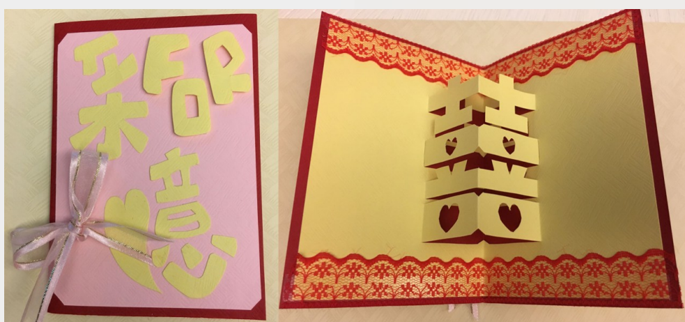
北一女手語社學姊的結婚賀卡。

如果說高中是青春的歲月，我說：「北一手語社就是青春的代名詞。」高中加入手語社，在裡面結識了一群共同打拼的夥伴們，為了同一個舞台揮灑著汗水與熱情。北一手語就像一個家，歷屆的學姊們將這其中的情感代代傳承下來。在這裡，我遇見了同樣愛著北手的人們，儘管相差十幾歲，那都不是問題。這是一張