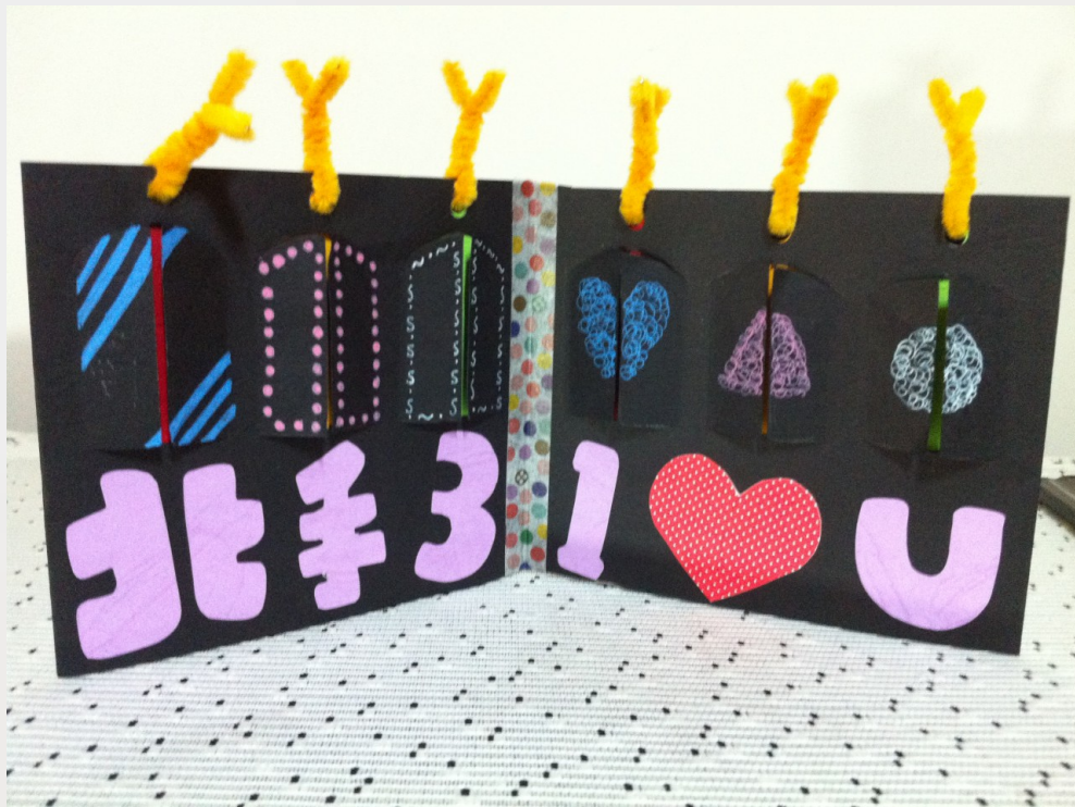
手語社朋友的生日卡片，集結所有社員們的祝福而製。

送給北手學姊的結婚賀卡，婚禮當日除了有專屬於「北一手語」的一桌，更安排了打社歌的橋段。一個「囍」字，祝福學姊在未來的日子裡能永遠幸福快樂，就像學姊曾經帶給我的溫暖一樣，是一份永不散去的感情。