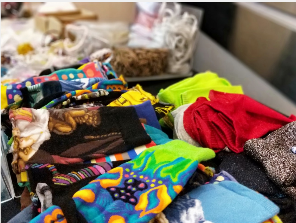
襪子從大學開始在楊慧淳的生命裡扮演重要角色。(圖片來源 / 汪彥彤攝)

當時就讀國立台中教育大學幼兒教育學系的楊慧淳，發現襪子顏色繽紛且取材容易，另外，材質彈性所以方便塑型，因此她決定在教具設計比賽中利用襪子製作獨樹一格的教具，因為從來沒有人這麼做過，所以令評審眼睛為之一亮，最後贏得好名次。誰會想到，那時候的一個小事件，成為一顆種子，在她的人生旅途裡漸漸萌芽。