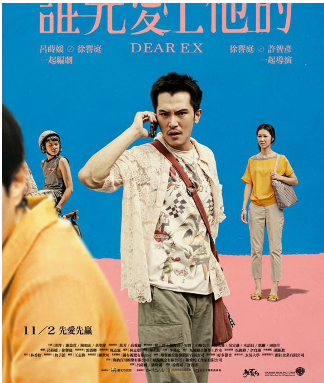
台灣本土電影《誰先愛上他的》的故事背景依舊環繞在男同志身上。