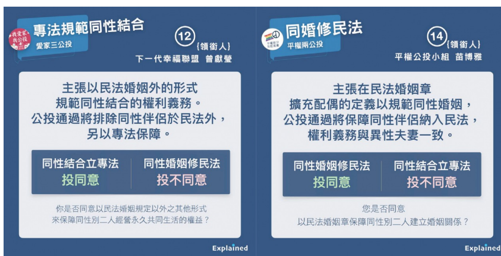
公投第十二、十四案的懶人包。

在眾多的懶人包中不乏有將正反論述並呈、角度客觀公正的，坦蕩地列出各方的提案理由，然而未能深度解讀資訊的情況下，資訊吸收愈多，反而愈易感到困惑與混淆。舉例來說，公投第十二案（同性婚姻應另立專法）與十四案（同性婚姻應入民法）相互對抗，但卻有相同的提案理由：可以降低社會成本。第十二案的公投理由書提及，改變現有民法婚姻定義將會耗費龐大的行政和立法資源；第十四案的公投理由書解釋若另立專法，將增加法律解釋適用的困難，增加社會的成本。礙於懶人包的特性，將會陷入精簡扼要和敘述詳實的兩難，除非選民能夠主動地去查詢更多的資料佐證，否則只會增加判讀上的困擾。